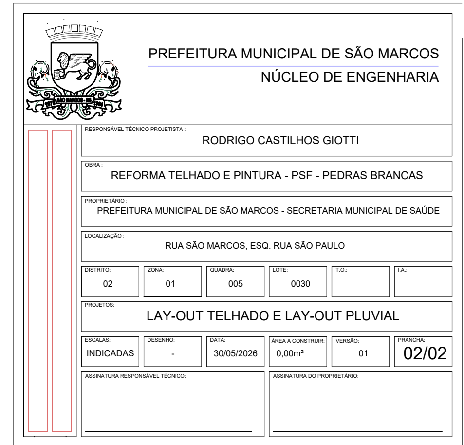
LAY-OUT PLUVIAL Escala 1/50

OS TUBOS DE QUEDA PLUVIAIS SERÃO DESLOCADOS PARA JUNTO DAS PAREDES A FIM DE EVITAR DANOS FUTUROS DN 100mm