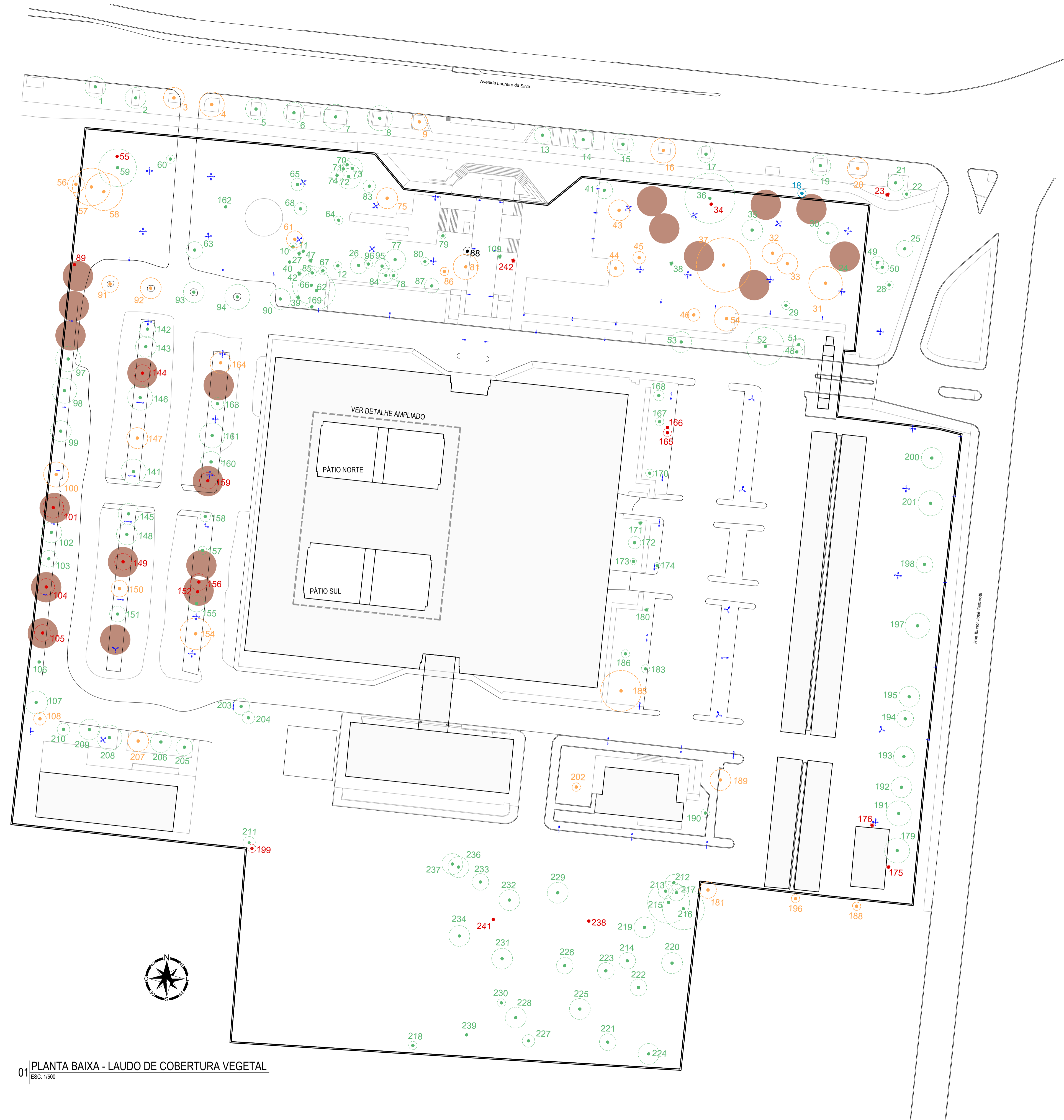
01 PLANTA BAIXA - LAUDO DE COBERTURA VEGETAL ESC. 1:500