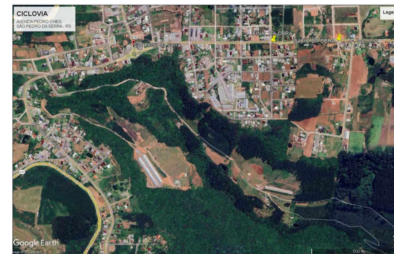
IMPLANTAÇÃO CICLOVIA SEM ESCALA