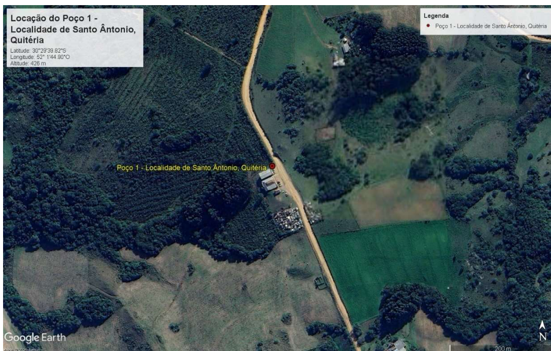
Figura 2. Localização do ponto de perfuração.