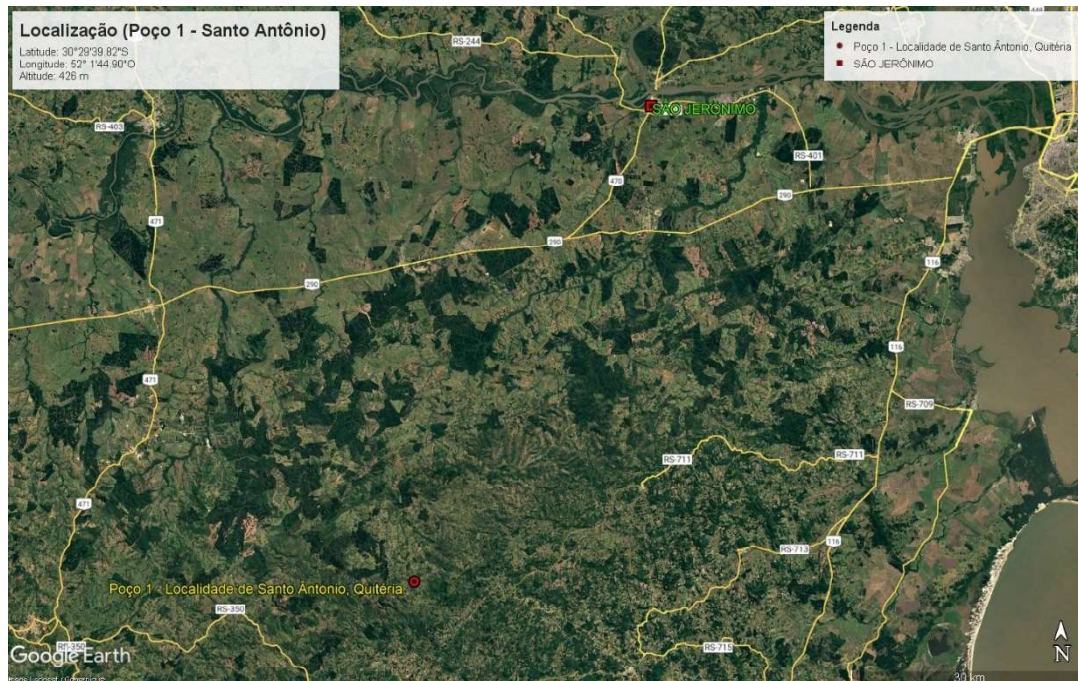
Figura 1. Localização da área de estudo em relação à zona urbana de São Jerônimo/RS.

A Figura 1, a seguir, apresenta a localização da área de estudo em relação à zona urbana de São Jerônimo .