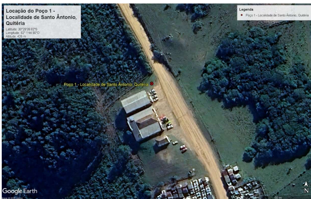
Figura 3. Detalhe da localização do ponto de perfuração sugerido.