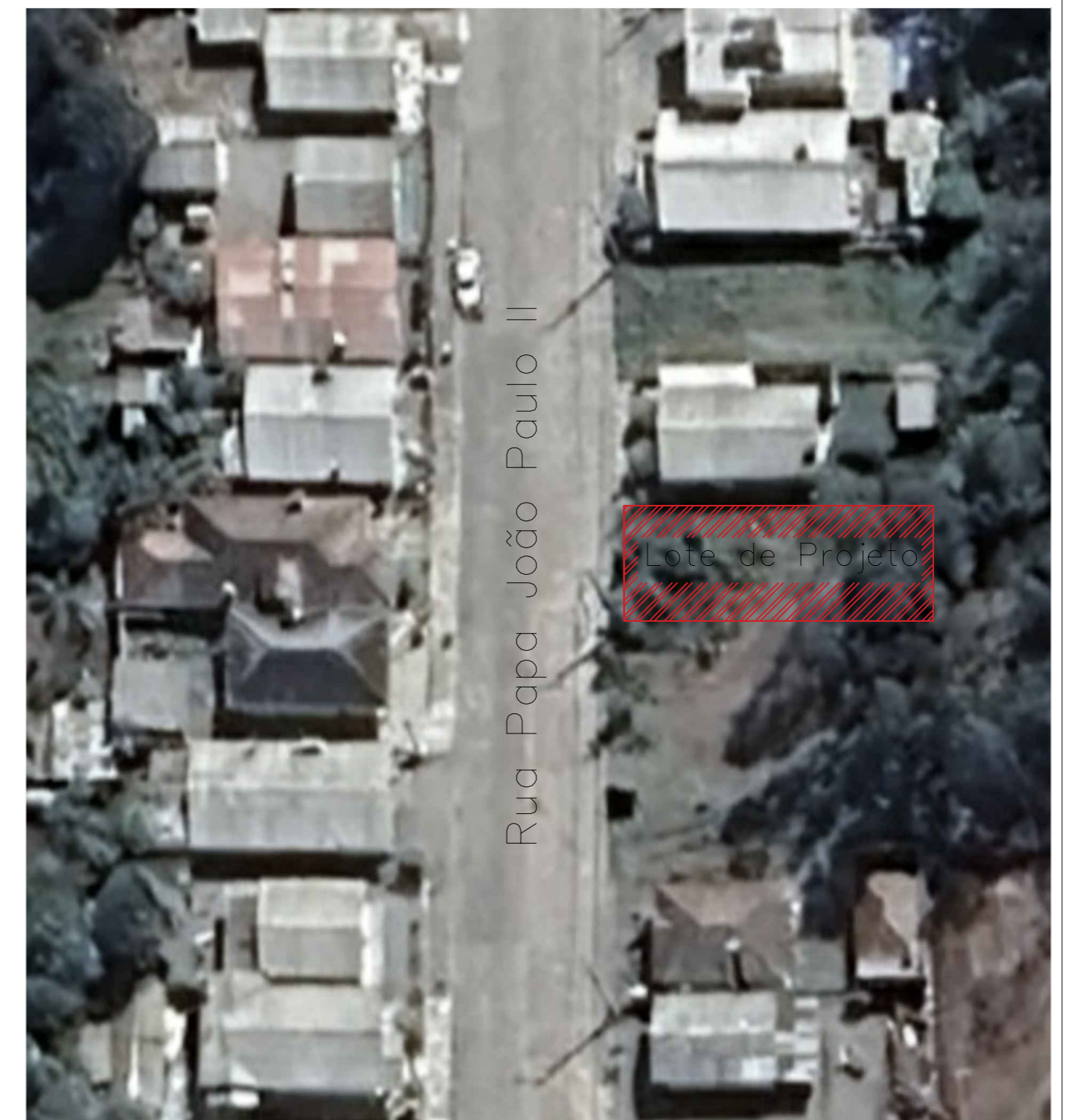
Situação e Localização | esc 1:500