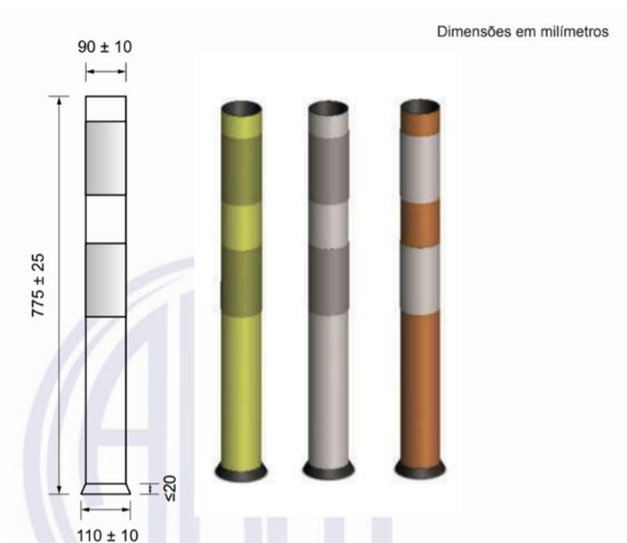
Figura 1 - Representação técnica quanto às dimensões de altura e diâmetro para cilindro delimitador Tipo II