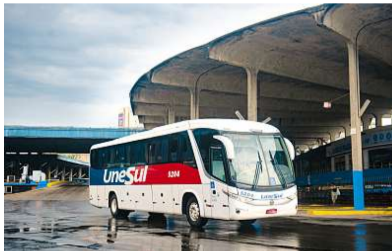
Alterações serão feitas de forma gradual durante este mês