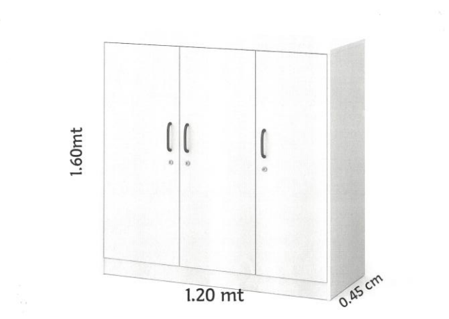
Modelo de armário