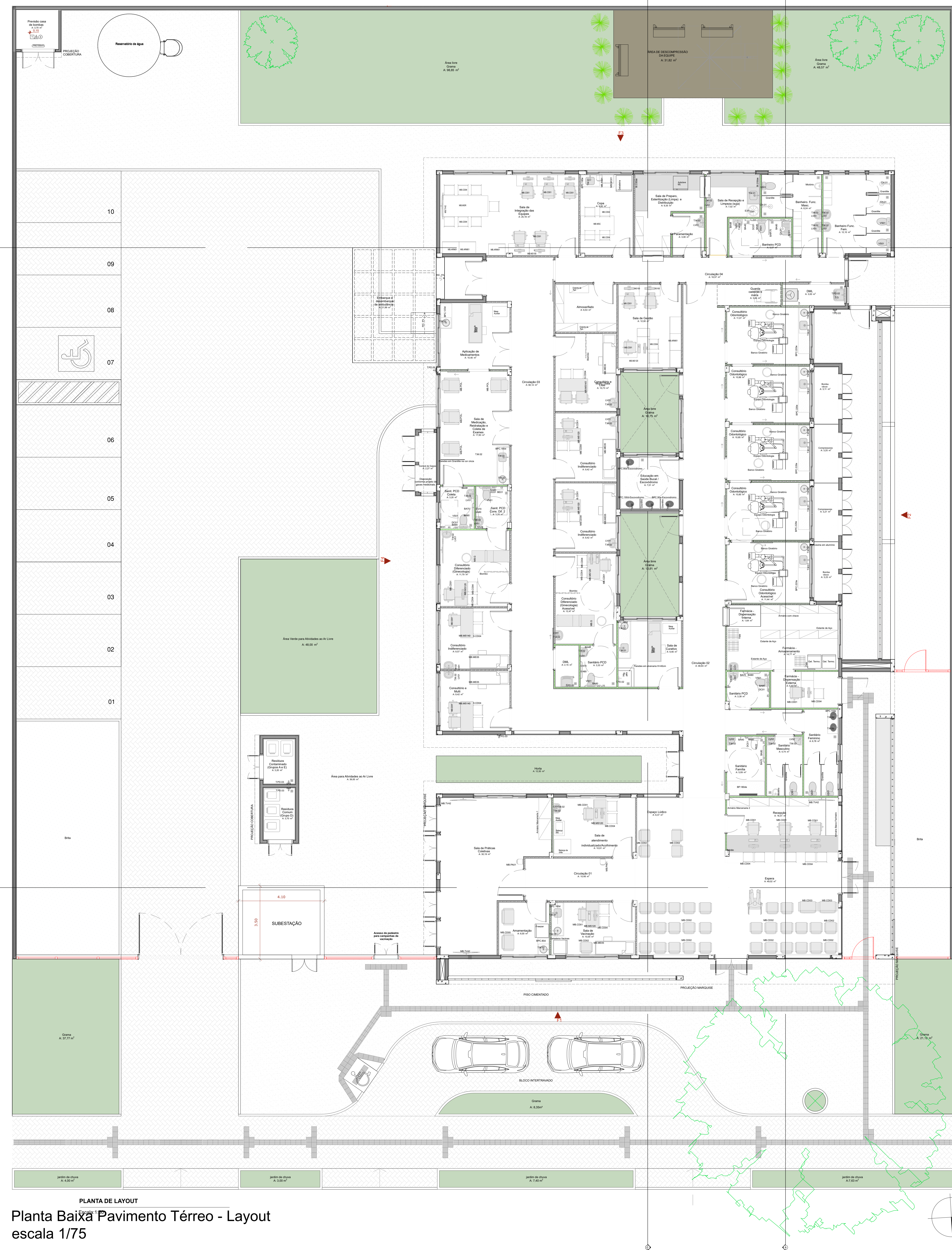
PLANTA DE LAYOUT Planta Baixa Pavimento Térreo - Layout escala 1/75