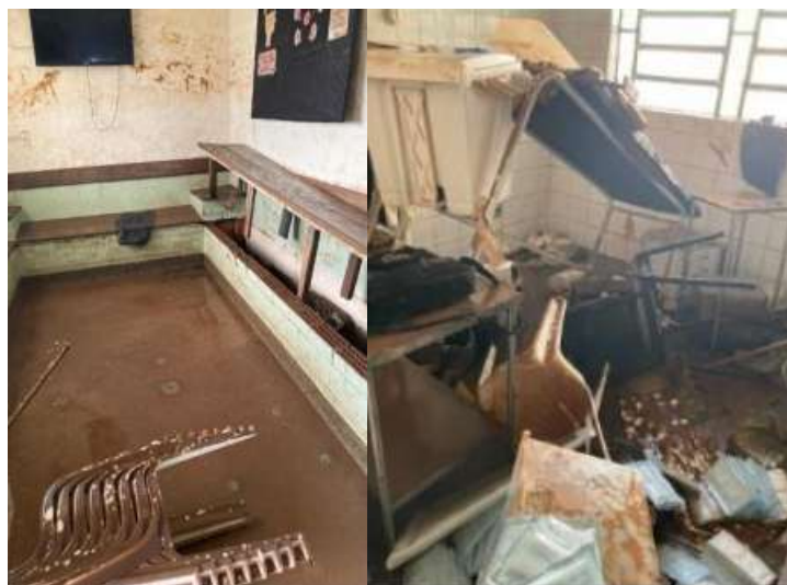
Figura 3: Imagens dos espaços internos da UBS Santo Operário.

Conforme vistorias realizadas, no local após a enchente, constatou-se que a água contaminada afetou os espaços e as instalações da edificação, conforme exposto nas Figura 3 e