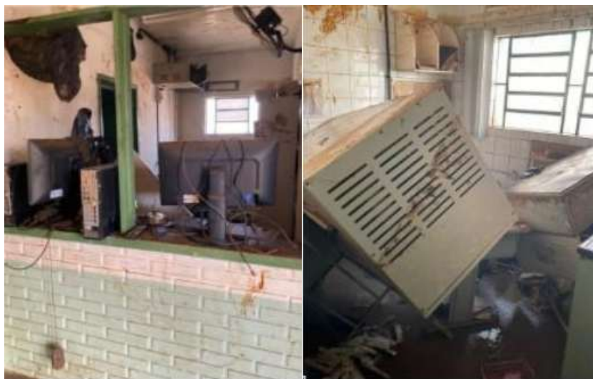
Figura 4: Imagens dos espaços internos da UBS Santo Operário.

Tendo em vista a necessária retomada das atividades da UBS, foram realizados procedimentos emergenciais de reforma através de empresa contratada para a manutenção. Apesar da contribuição para a retomada das atividades da referida unidade de saúde, restam ainda adequações a realizar. Os serviços indicados visam a adequação da estrutura física às normas vigentes, bem como maior durabilidade e redução dos custos provenientes dos procedimentos de manutenção na edificação.