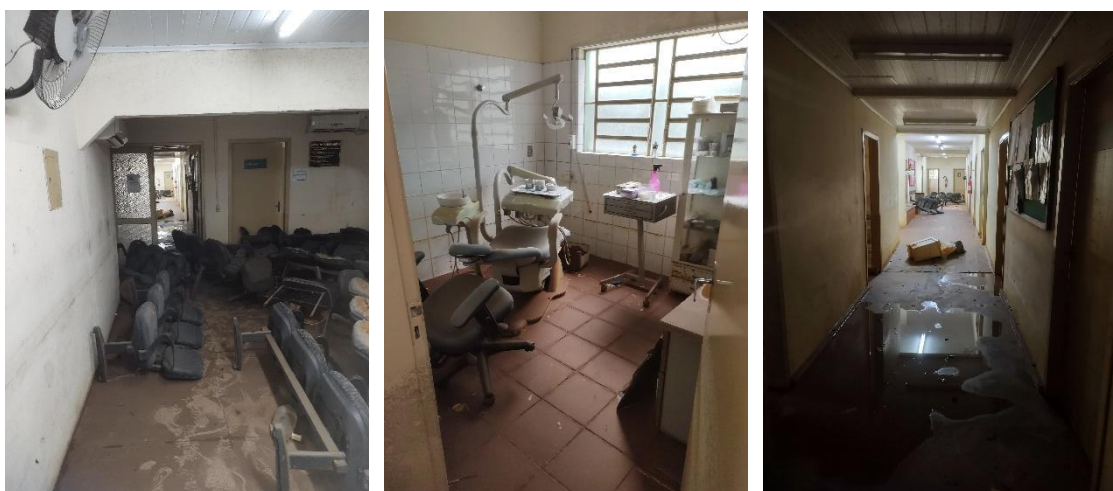
Figuras 5, 6 e 7: Imagens internas da US União.