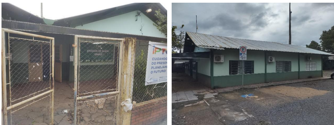
Figuras 3 e 4: Imagens externas da US União.

Conforme vistorias realizadas no local após a enchente, constatou-se que a água contaminada afetou os espaços e as instalações da edificação, conforme Figuras 3 e 4 (externas), e Figuras 5, 6 e 7 (internas).