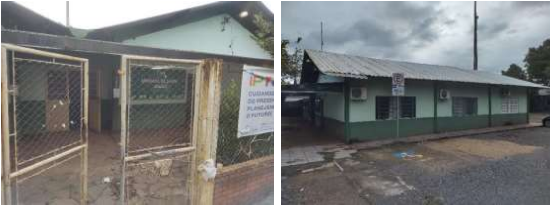
Figuras 3 e 4: Imagens externas da US União.

Conforme vistorias realizadas no local após a enchente, constatou-se que a água contaminada afetou os espaços e as instalações da edificação, conforme Figuras 3 e 4 (externas), e Figuras 5, 6 e 7 (internas).