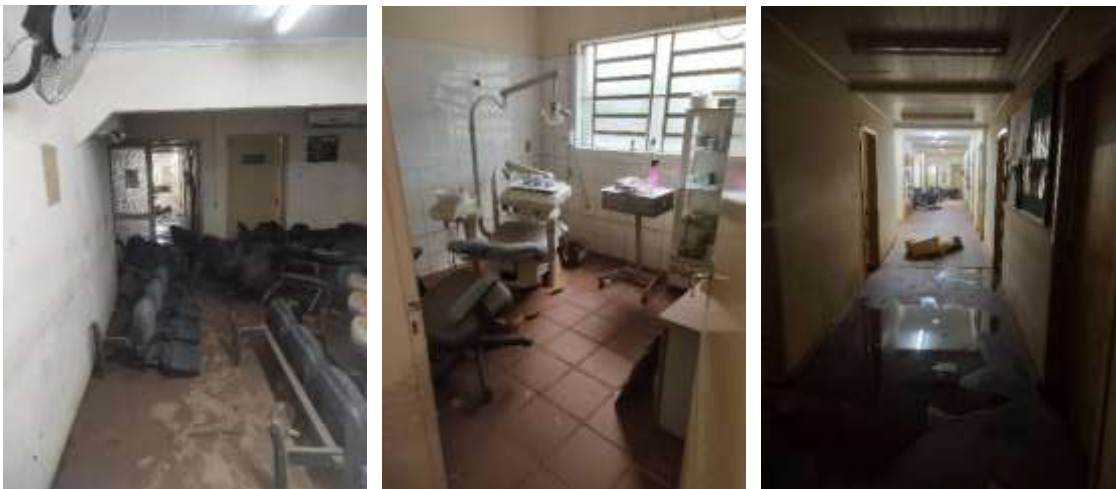
Figuras 5, 6 e 7: Imagens internas da US União.