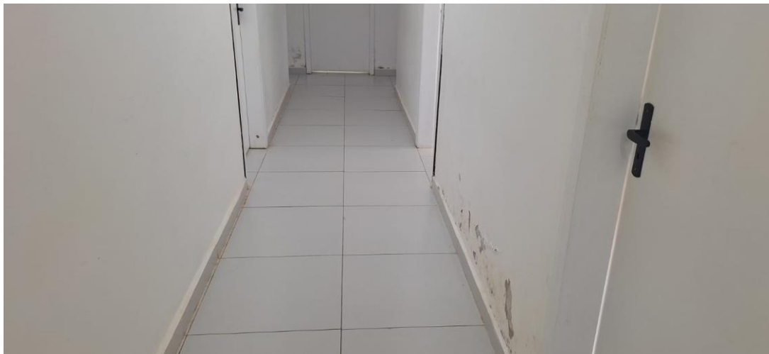
Imagem do corredor interno