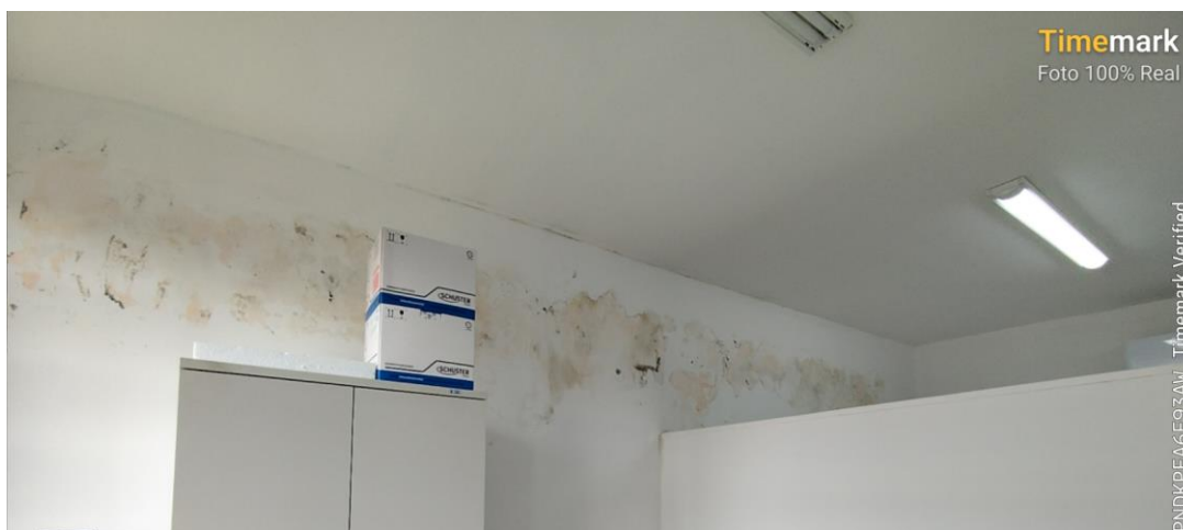
Imagem sala de atendimento odontológico

A premissa de projeto para este recurso foi a de recuperar a edificação após os danos e propor algumas melhorias. Estão previstos serviços de demolições e reparação do reboco comprometido com umidade, instalação de novas esquadrias (portas), execução de novo piso no pátio interno bem como no acesso, substituição do sistema de cobertura, pinturas internas e externas, execução de limpeza nas redes, execução de área coberta na entrada da edificação e substituição dos pisos de PAVS no passeio e acesso à UBS.