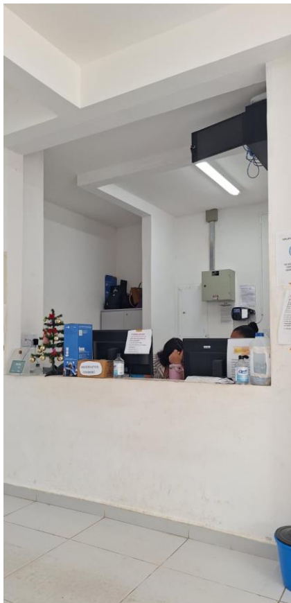
Imagem guichê aberto