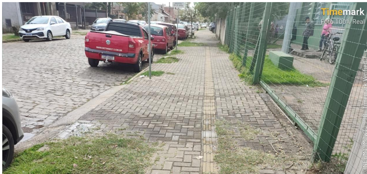
Passeio e cercamento atual