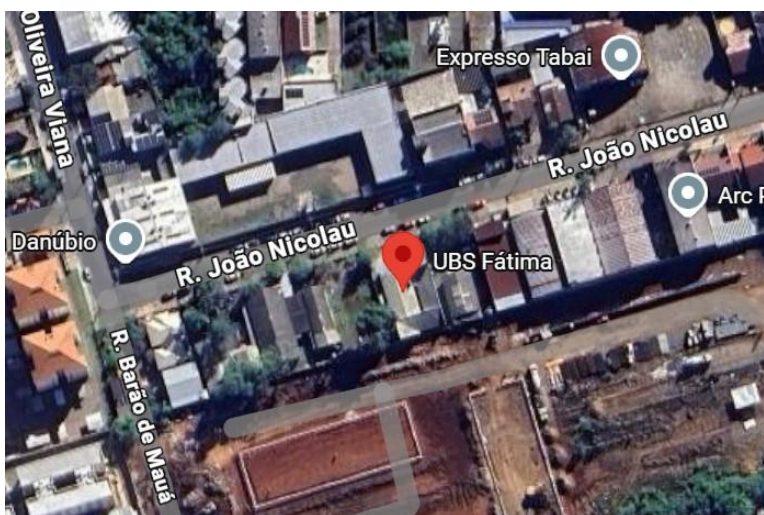
Foto aérea UBS Fátima