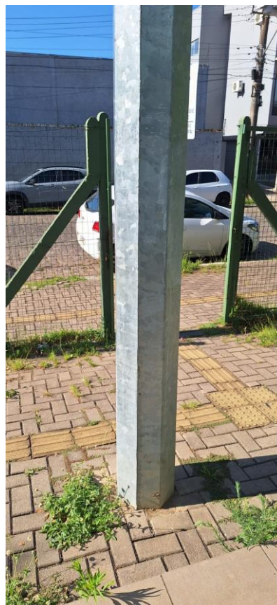
Imagem da antena no acesso

Na entrada da UBS observou-se duas situações que podem ser melhoradas, a primeira é que há uma antena instalada exatamente na área de circulação de pessoas (o que impossibilita a correta instalação do piso tátil que encaminha para a rampa de acesso) e a segunda é a falta de proteção meteorológica pra quem possa estar chegando ou saindo do lugar.