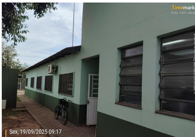
Imagem acesso lateral

Também foi detectado que na porta de entrada lateral há um problema de entrada da água da chuva, neste caso propomos uma cobertura sobre a área da entrada e um acréscimo no sistema de drenagem junto a este espaço.