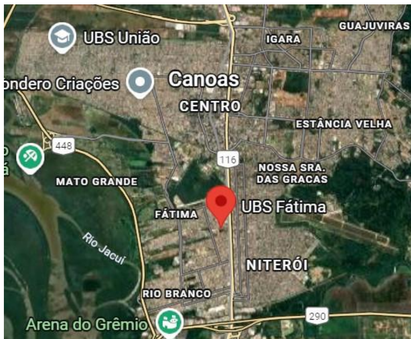
Mapa de Canoas