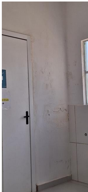
Imagem entrada sanitário

Conforme descrito, será necessário contratar empresa especializada em arquitetura e/ou engenharia para reforma da UBS Fátima.