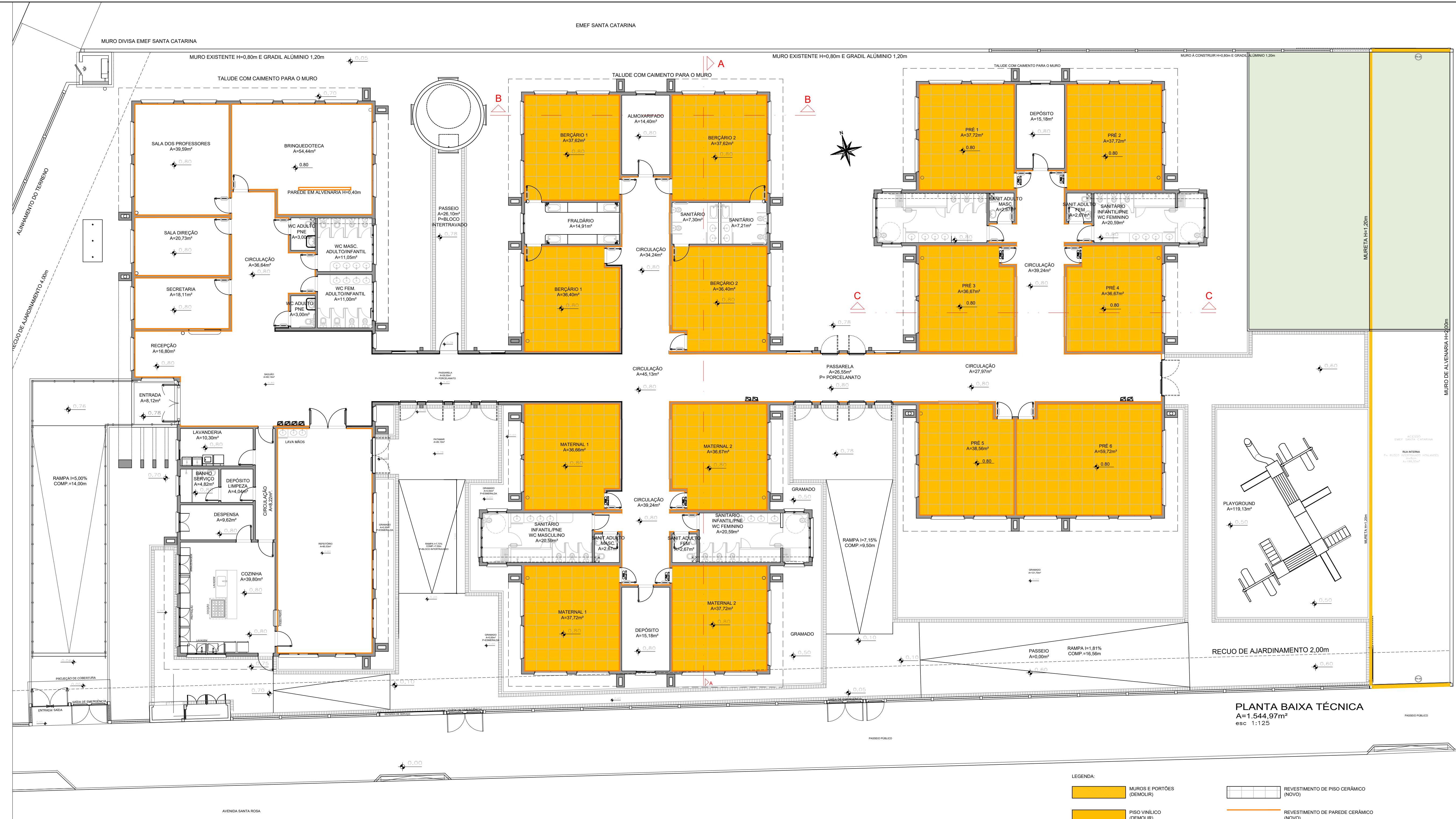
PLANTA BAIXA TÉCNICA A=1.544,97m 2 esc 1:125