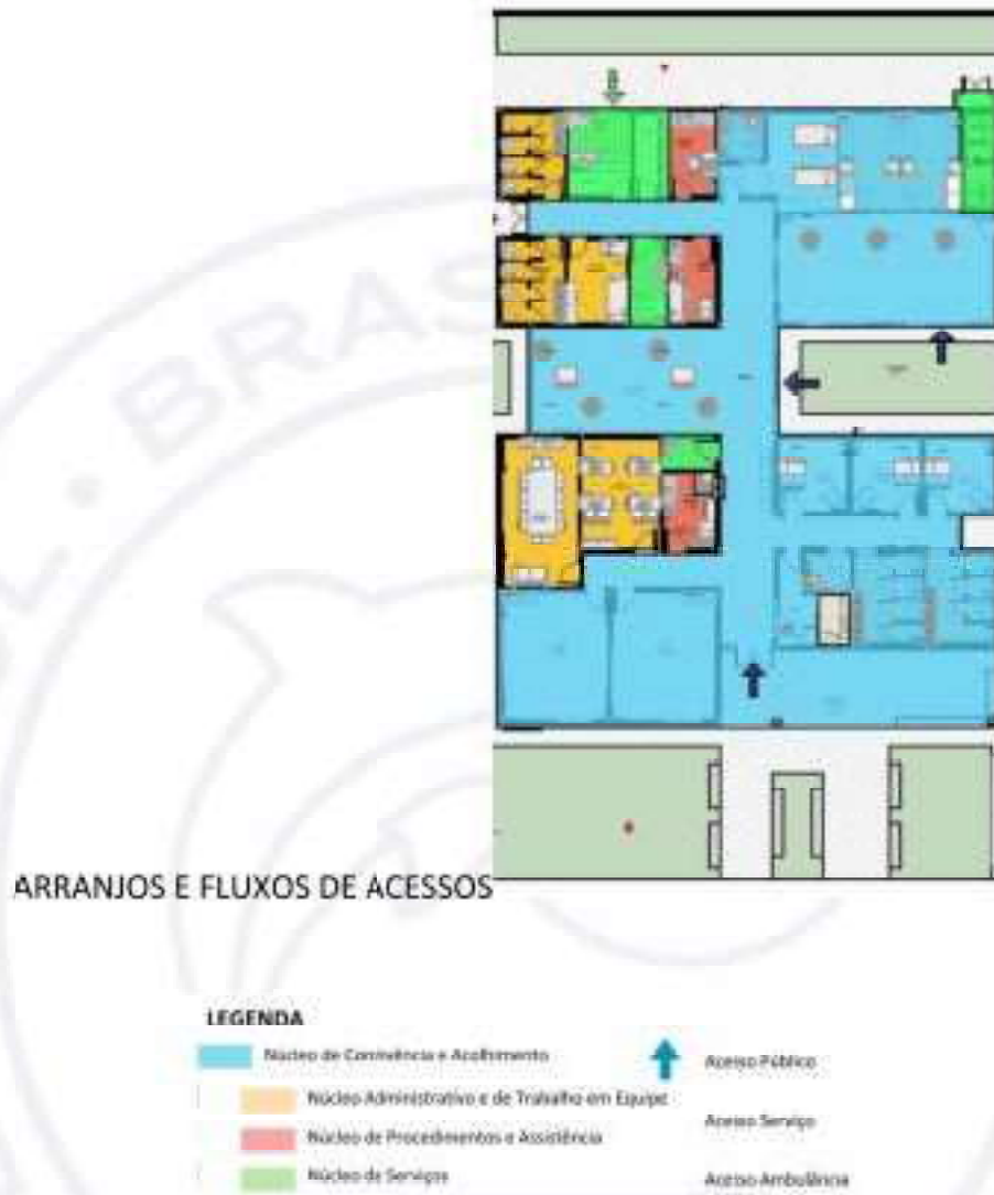
Figura 2: Arranjo espacial dos núcleos e seus fluxos