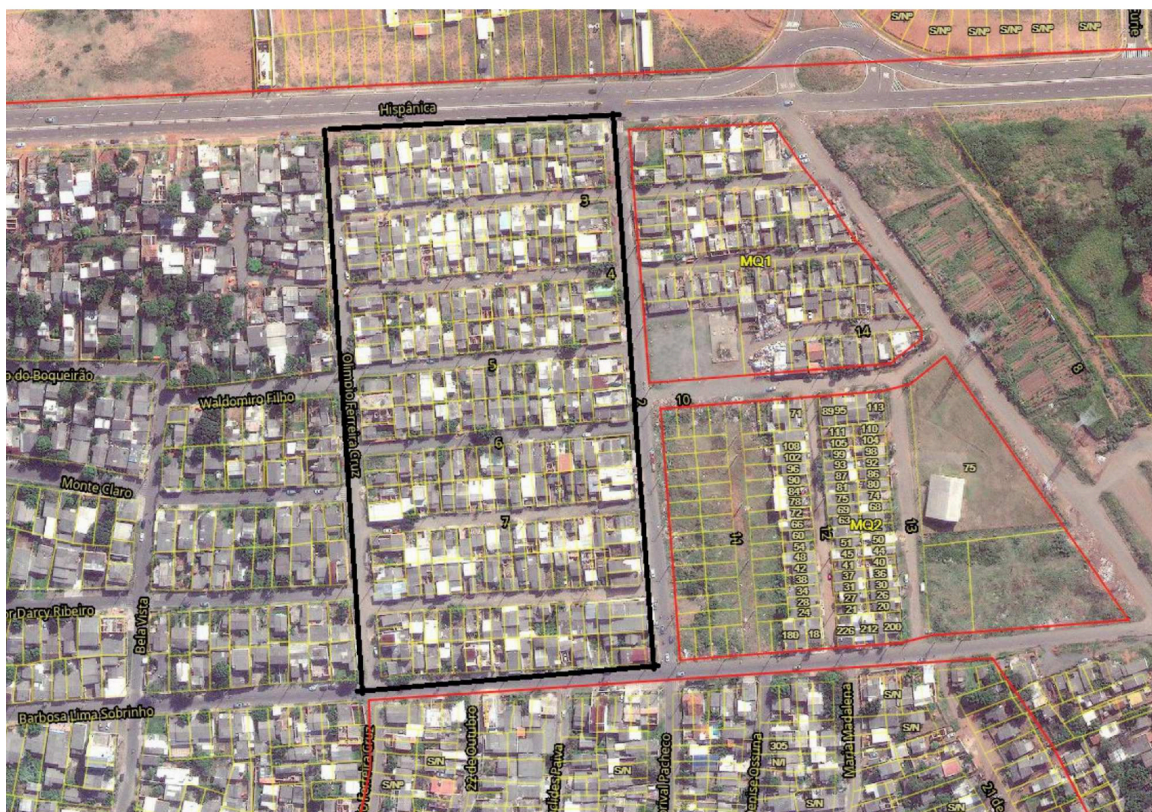
Imagem 1: Localização das Poligonal

O bairro Guajuviras está localizado na região nordeste do Município de Canoas, com entorno imediato ocupado pela Estrada do Nazário, pela Avenida Boqueirão e pela Avenida 17 de Abril. A poligonal do núcleo urbano informal MQ1 está localizada conforme a seguinte imagem.