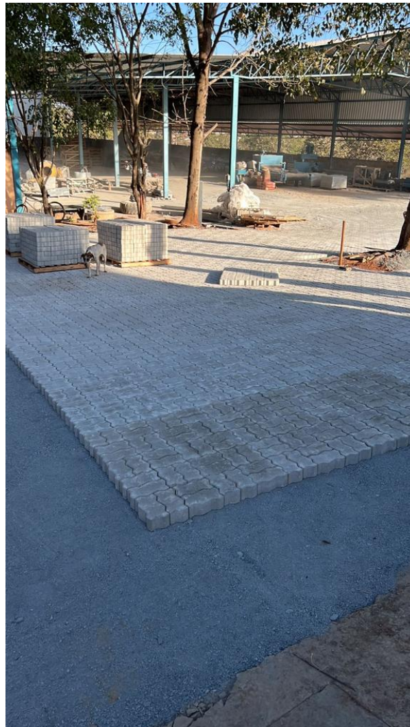
Figura 2 - Trama executada no Modelo Unistein no retângulo 5x4.

Campina das Missões, 06 de março de 2025.