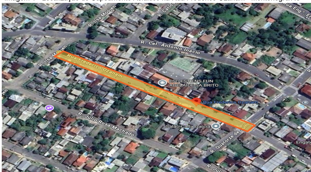
Imagem 1 - Localização do Capeamento Asfáltico na Rua Frederico Ozanam - Montenegro/RS