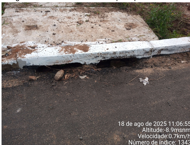
Imagem de boca de lobo com bloqueio parcial de CBUQ

18 de ago de 2025 11:06:55 Altitude:-8.9msnm Velocidade:0.7km/h Número de índice: 1343