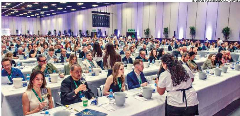
Foram servidos 960 litros, volume equivalente a 1.260 garrafas, em um serviço com mais de 100 participantes na Serra