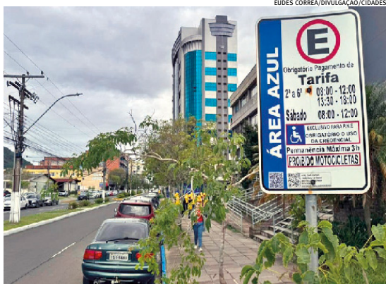
Motoristas vão pagar R$ 2,00 pela hora, uma queda de 20% no valor anterior