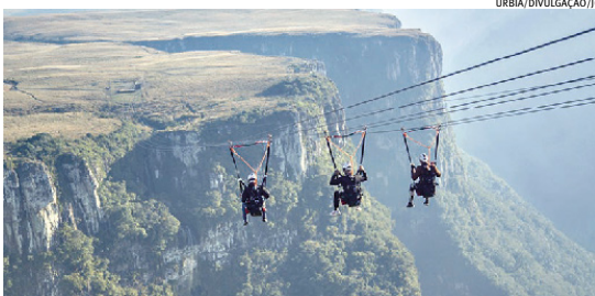
Concessionária suspendeu o atrativo em 2024 por conta da baixa procura de turistas

A expectativa é de que a reabertura ocorra ainda em 2025. A data ainda não foi confirmada pela gestora, que deve fornecer mais informações nos próximos dias.