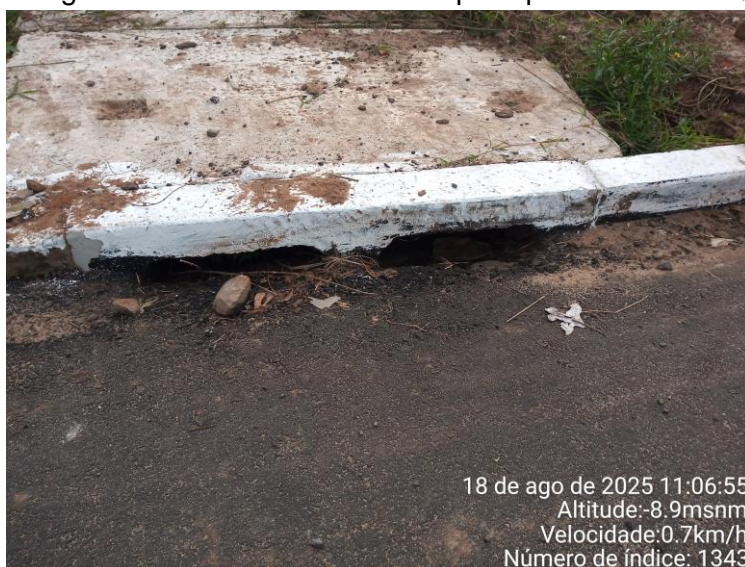
Imagem de boca de lobo com bloqueio parcial de CBUQ

O cumprimento desta determinação assegura a eficiência da rede de drenagem, a durabilidade do pavimento e conformidade com as normas de drenagem urbana (ABNT NBR 9575:2010).