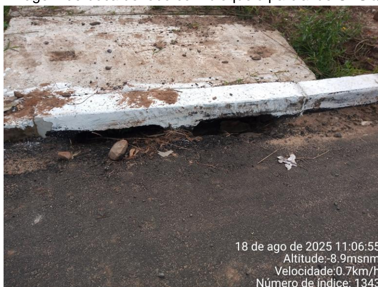
Imagem de boca de lobo com bloqueio parcial de CBUQ

O cumprimento desta determinação assegura a eficiência da rede de drenagem, a durabilidade do pavimento e conformidade com as normas de drenagem urbana (ABNT NBR 9575:2010).