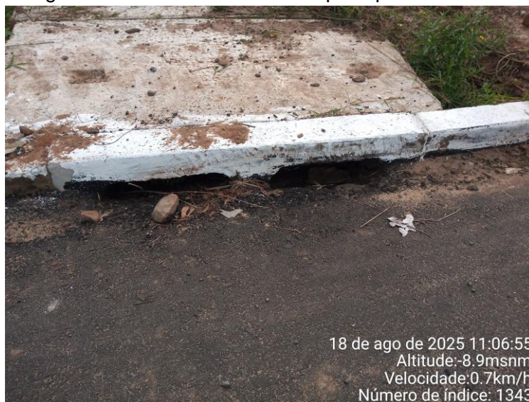
Imagem de boca de lobo com bloqueio parcial de CBUQ

O cumprimento desta determinação assegura a eficiência da rede de drenagem, a durabilidade do pavimento e conformidade com as normas de drenagem urbana (ABNT NBR 9575:2010).