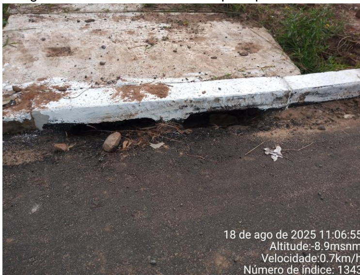
Imagem de boca de lobo com bloqueio parcial de CBUQ

O cumprimento desta determinação assegura a eficiência da rede de drenagem, a durabilidade do pavimento e conformidade com as normas de drenagem urbana (ABNT NBR 9575:2010).