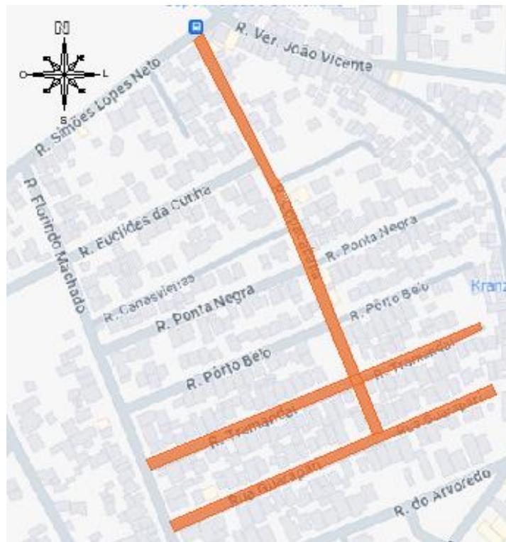
Localização Ruas Copacabana, Tramandai e Guarapari – Montenegro/RS