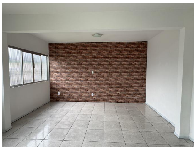
Imagem: Salas de acolhimento

Na sala de atendimento, o ponto de iluminação existente também será desativado, sendo reaproveitado para a derivação de dois novos pontos: um destinado à própria sala de atendimento e outro à recepção. A passagem dos cabos será executada parcialmente pelo teto, com a continuidade embutida nas paredes em drywall. Quanto a iluminação, a luminária existente será reaproveitada na recepção, uma vez que a sala de atendimento receberá nova luminária tipo plafon quadrada, de sobrepor, de 17x17cm.