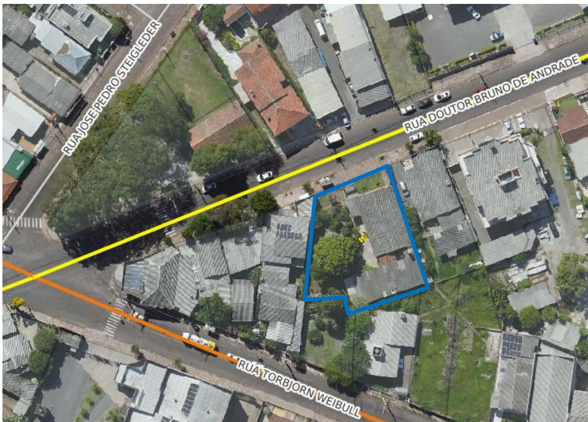
Imagem de satélite: Localização CAPS Infantil

LOTE 01: CAPS Infantil – Rua Doutor Bruno de Andrade, nº 1480, bairro Timbaúva – Montenegro/RS