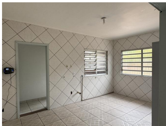
Imagem: Sala de atendimento

Na sala de atendimento, o ponto de iluminação existente também será desativado, sendo reaproveitado para a derivação de dois novos pontos: um destinado à própria sala de atendimento e outro à recepção. A passagem dos cabos será executada parcialmente pelo teto, com a continuidade embutida nas paredes em drywall. Quanto a iluminação, a luminária existente será reaproveitada na recepção, uma vez que a sala de atendimento receberá nova luminária tipo plafon quadrada, de sobrepor, de 17x17cm.