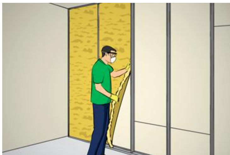
Ilustração: instalação do isolamento acústico – Leroy Merlin

Para a segunda camada de gesso, fixar as chapas por meio de parafusos com 45mm de comprimento especialmente desenvolvidos para esse fim. As juntas da primeira camada nunca podem coincidir com as juntas da segunda camada de chapas.