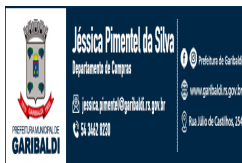
jessica-pimentel.jpg 86 KB