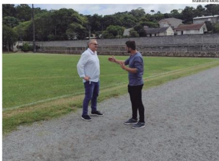
Obra já era para estar pronta há vários meses

O esporte tem um papel fundamental no desenvolvimento social e na qualidade de vida dos cidadãos, e a gestão segue empenhada em oferecer melhores condições para atletas, praticantes e toda a comunidade.