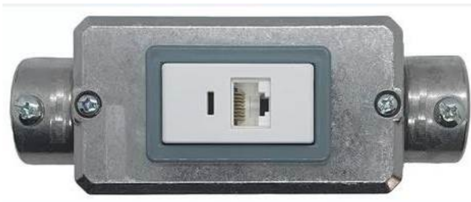
Imagem 02 – Exemplo de tomada RJ45 em condutele metálico tipo C (pode ser utilizado condutele metálico de múltiplas entradas, desde de devidamente fechadas as entradas sem uso com tampão)