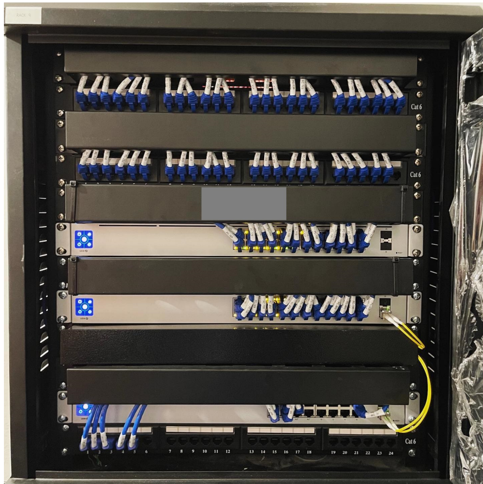
Imagem 03 – Padrão de montagem e acabamento de Rack.