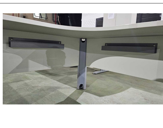
Fig. 10: Mesa Formato L 140cm - Amostra fornecida