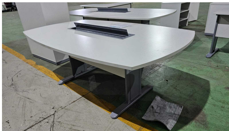
Fig. 17: Mesa para Reunião 8 lugares – MR8P - Amostra fornecida

08) Mesa para Reunião 8 lugares – MR8P – Através de inspeção visual simples foi constatado que o item não possui bucha metálica para instalação dos parafusos de fixação das retaguardas.