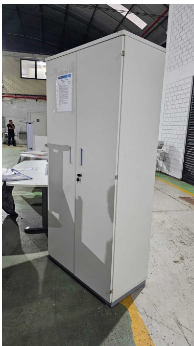
Fig. 03: Armário Alto com 2 portas -AA1 - Amostra fornecida

02) Armário Alto com 2 portas -AA1 – Através de inspeção visual simples foi constatado que o item atende ao exigido pelo edital.