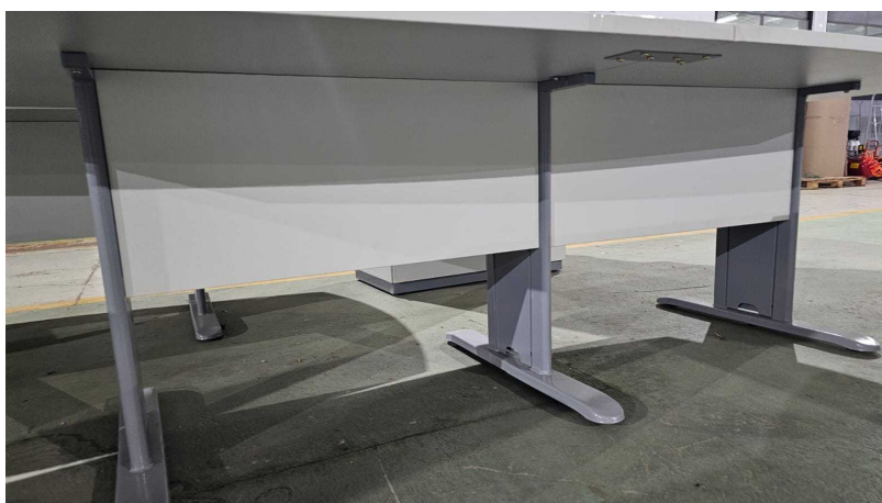
Fig. 20: Mesa para reunião 10 lugares – MR10P - Amostra fornecida