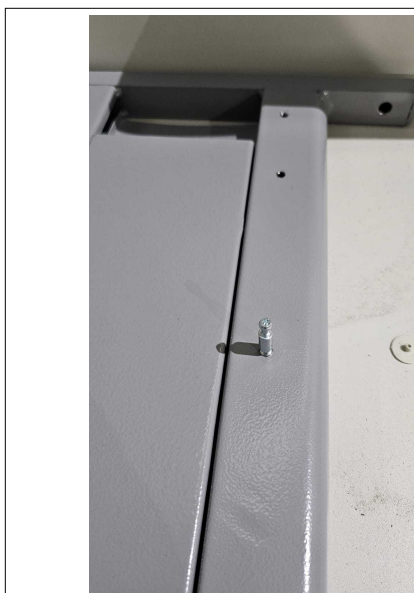
Fig. 11: Mesa Formato L 140cm - Amostra fornecida