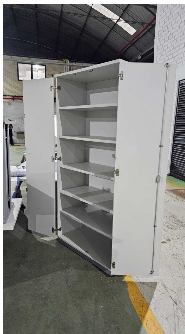
Fig. 04: Armário Alto com 2 portas -AA1 - Amostra fornecida