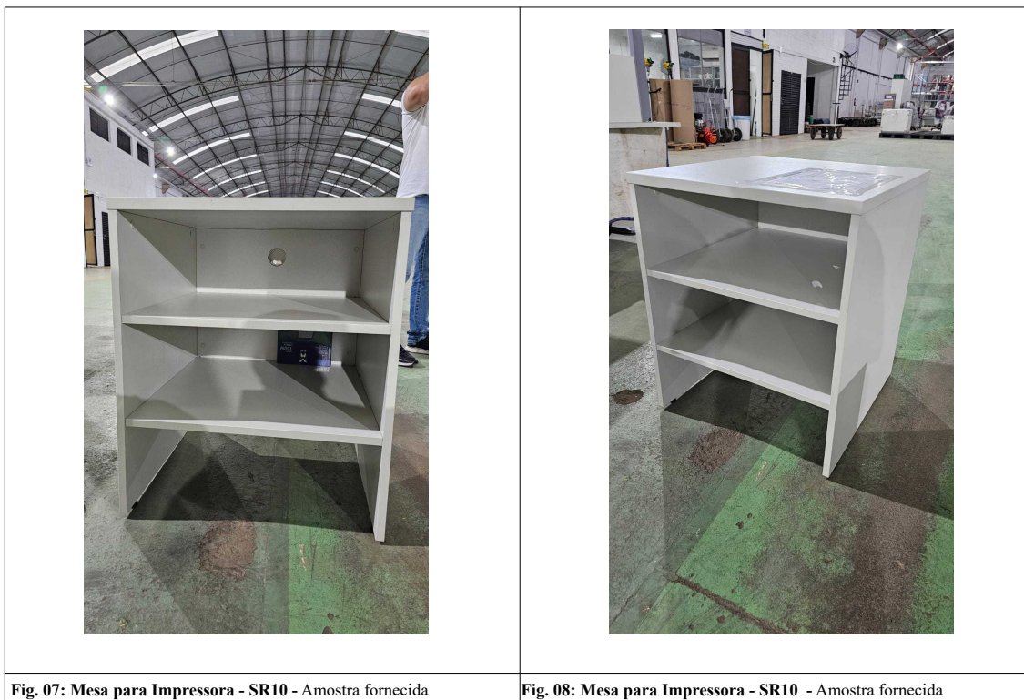
Fig. 07: Mesa para Impressora - SR10 - Amostra fornecida

04) Mesa para Impressora - SR10 – Através de inspeção visual simples foi constatado que o item atende ao exigido pelo edital.