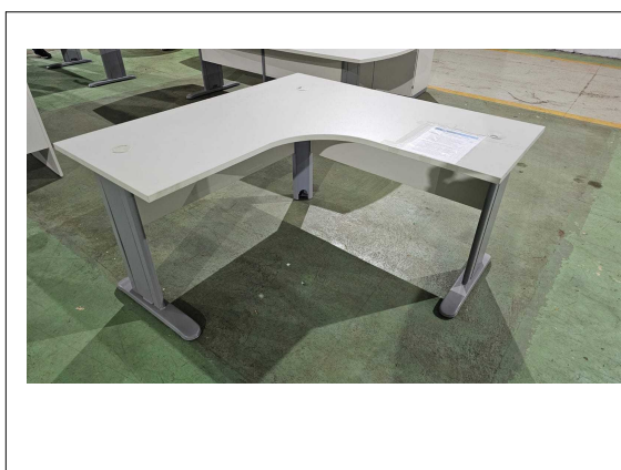
Fig. 09: Mesa Formato L 140cm - Amostra fornecida

05) Mesa Formato L 140cm – Através de inspeção visual simples foi constatado que o item não possui bucha metálica para instalação dos parafusos de fixação das retaguardas.