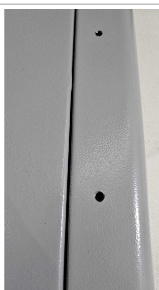
Fig. 12: Mesa Formato L 140cm - Amostra fornecida