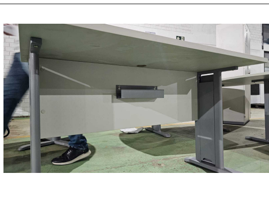
Fig. 14: Mesa Retangular 120cm - MR120 - Amostra fornecida