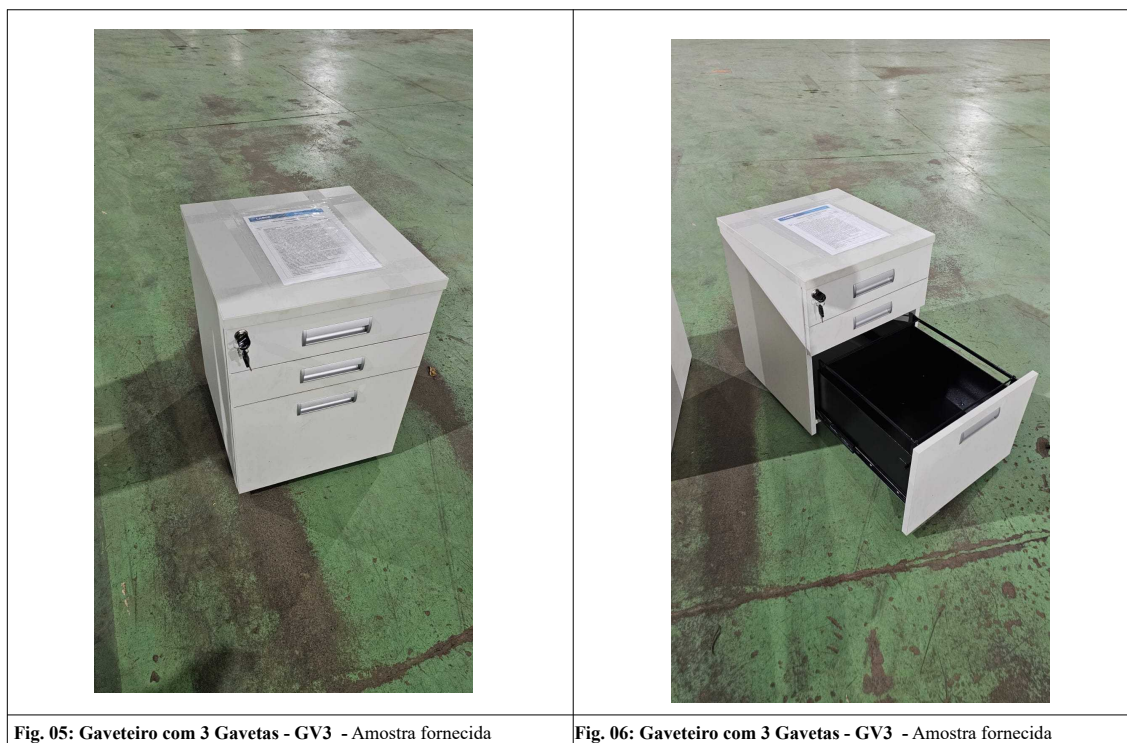
Fig. 05: Gaveteiro com 3 Gavetas - GV3 - Amostra fornecida

03) Gaveteiro com 3 Gavetas - GV3 – Através de inspeção visual simples foi constatado que o item atende ao exigido pelo edital.