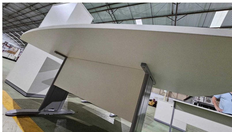
Fig. 18: Mesa para Reunião 8 lugares – MR8P - Amostra fornecida