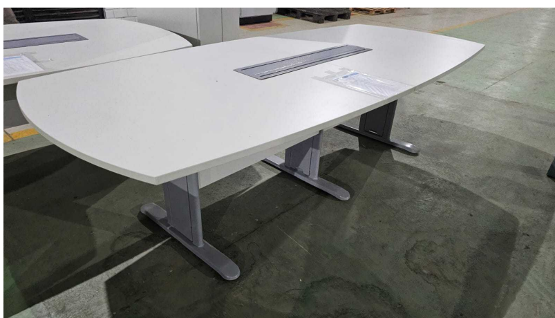
Fig. 19: Mesa para reunião 10 lugares – MR10P - Amostra fornecida

09) Mesa para reunião 10 lugares – MR10P – Através de inspeção visual simples foi constatado que o item não possui bucha metálica para instalação dos parafusos de fixação das retaguardas.