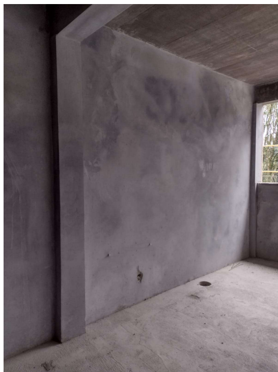
Imagem 07 – parte hidráulica da sala de aula