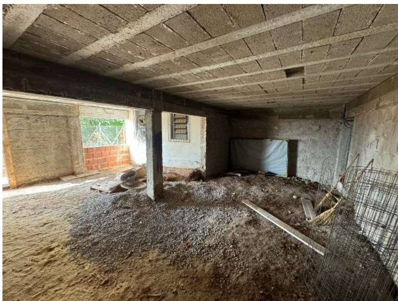
Imagem 13 – área interna do depósito no subsolo (atual)