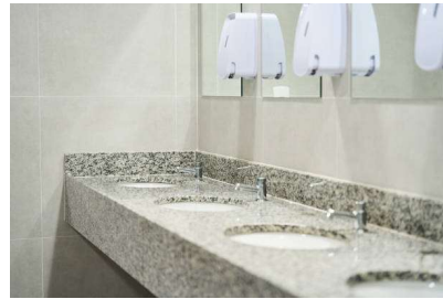
Figura 15 - Referência de bancada de banheiro