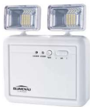
Figura 26 e 27 – Referências de luminárias de emergência

Deverão ser instalados os equipamentos (extintores, placas e luminárias) conforme projeto correspondente.