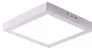
Figura 17 - Referência de luminária plafon de sobrepor