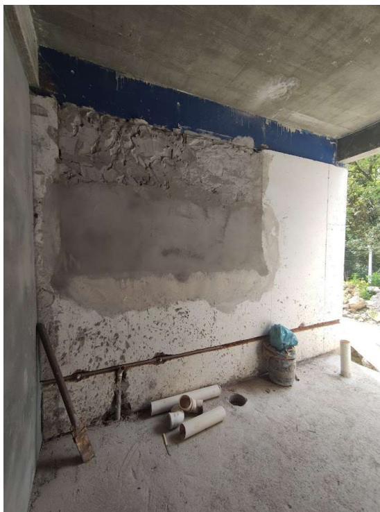
Imagem 06 – parte hidráulica do sanitário feminino