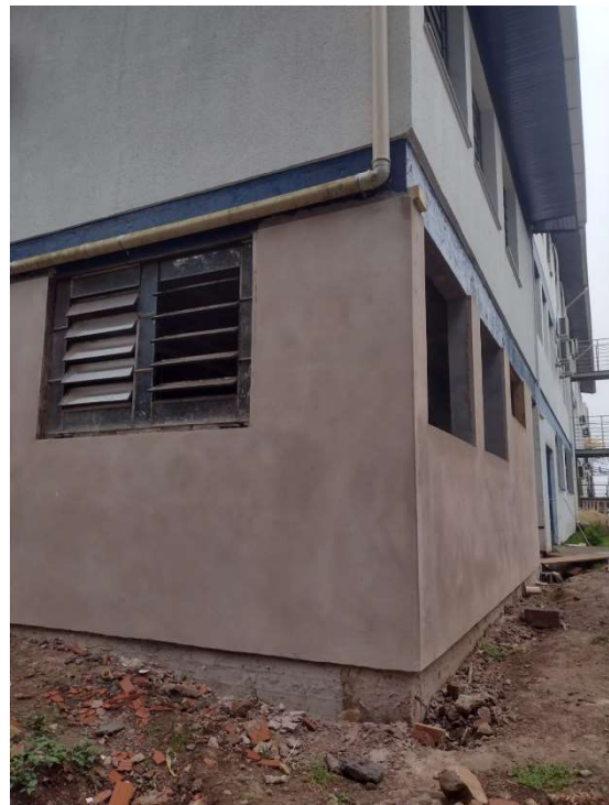
Imagem 02 – área existente (externo)