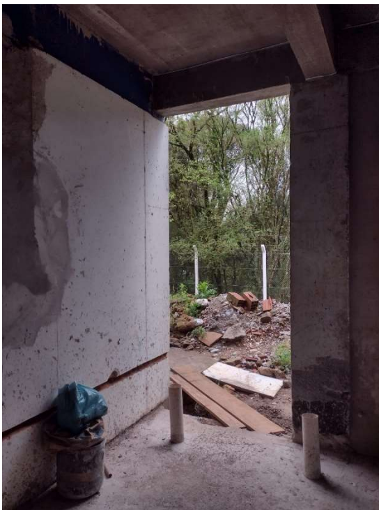
Imagem 01 – trecho de parede a construir

As vigas e pilares que estiverem expostos deverão ser requadrados.