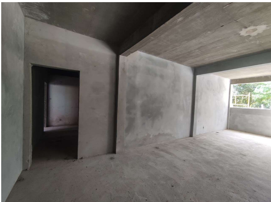
Imagem 05 – área existente (sala de aula)