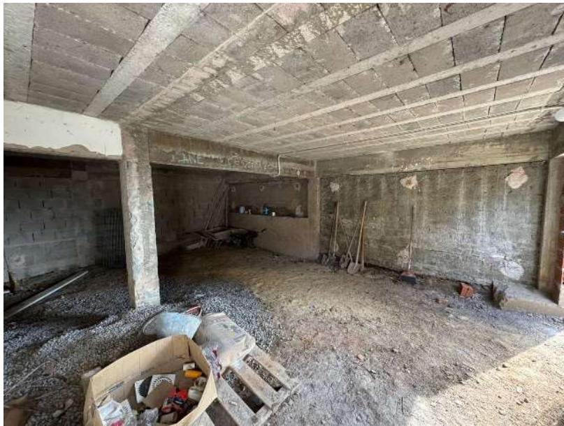
Imagem 12 – área interna do depósito no subsolo (atual)

A rede elétrica será executada através de eletrodutos que ficarão expostos. Os pontos a serem executados estão especificados no projeto correspondente.