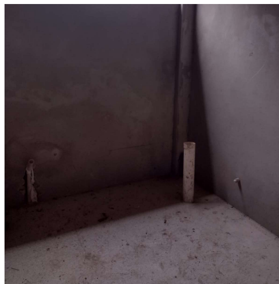
Imagem 10 e 11 – hidráulica do sanitário masculino