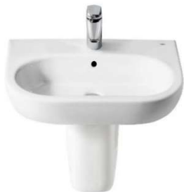
Figura 12 - Referência de coluna suspensa