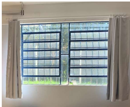
Figura 15 - Referência de esquadria existente