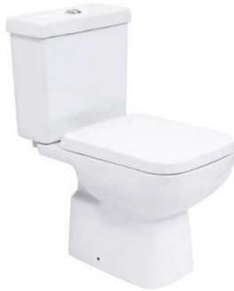
Figura 14 - Referência de vaso sanitário com caixa acoplada