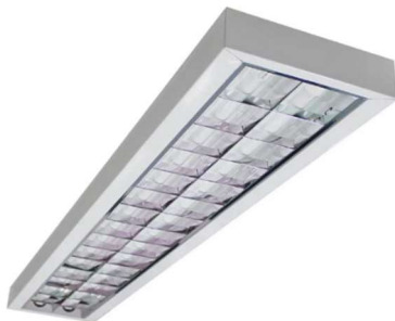
Figura 16 - Referência de luminária de sobrepor aletada com 120cm