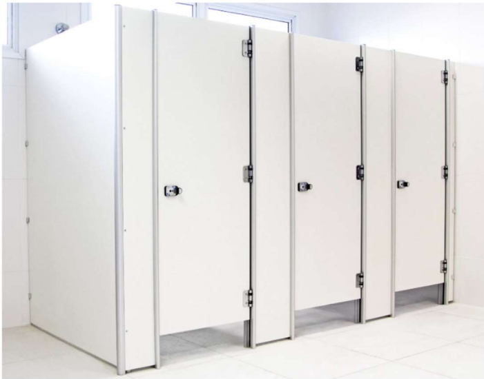
Figura 16 - Referência de divisórias leves de PVC.

As divisórias dos banheiros serão executadas com painéis de PVC. Os painéis e portas serão em chapa de PVC na cor branca. Os montantes serão perfil de alumínio com pintura eletroestática branca. Dobradiças e parafusos especiais em aço inoxidável, com acabamento em cromo natural. As fechaduras serão tipo tarjeta (livre / ocupado) em nylon. O serviço deverá ser executado por profissional capacitado.