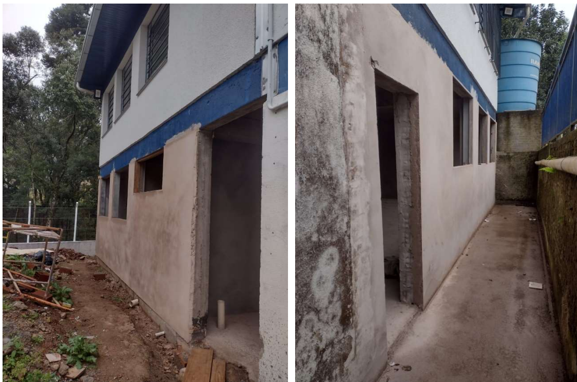
Imagem 03 e 04 – área existente (externo)