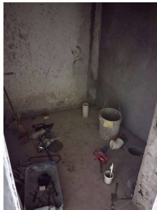
Imagem 08 e 09 – hidráulica do sanitário acessível