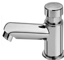
Figura 13 - Referência de torneira monocomando de bica baixa