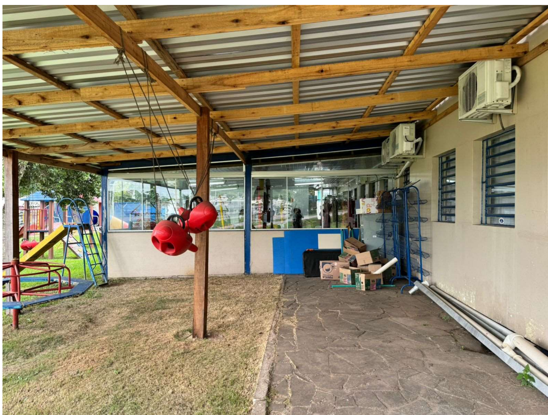
Figura 2 e 3 – Vistas da área existente