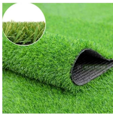
Figura 5 - Referência grama sintética de 20mm