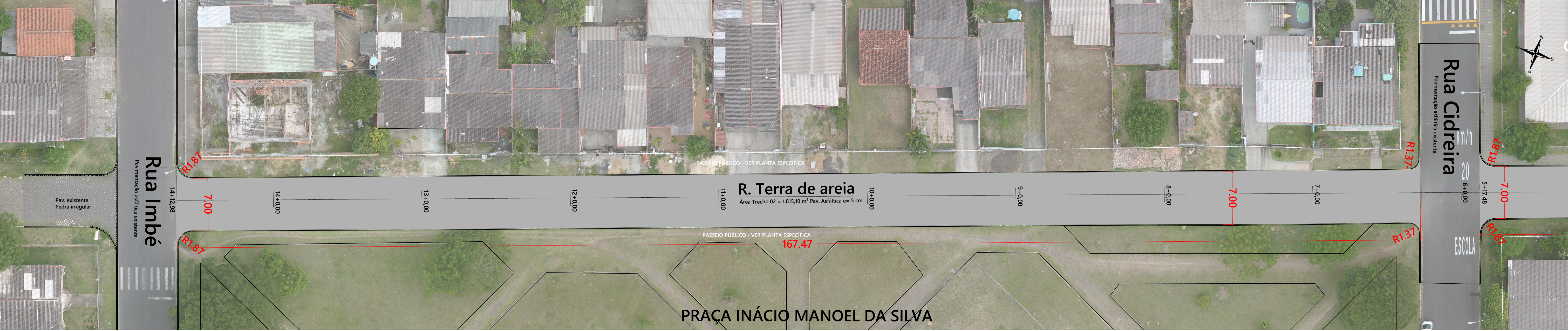
PLANTA GEOMÉTRICA - RUA TERRA DE AREIA (Estaca 06 a Estaca 14+12,98 ) Sem Escala