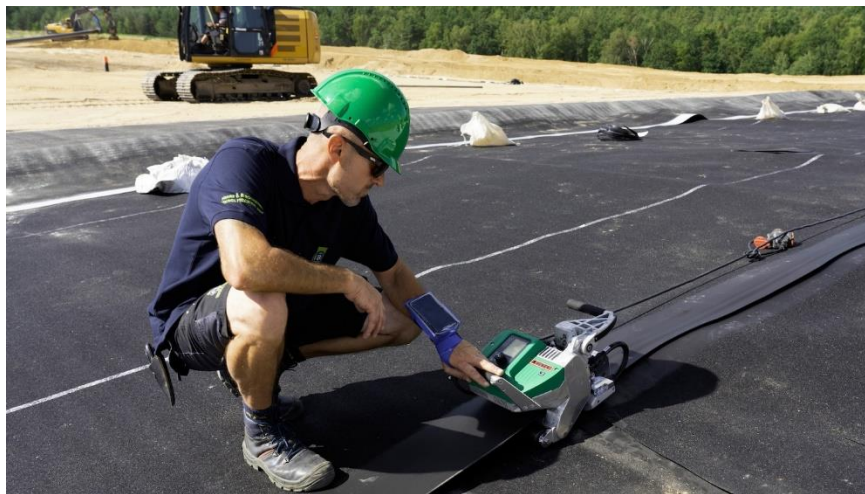
Figura 9 – Imagem de soldagem de mantas geomembrana PEAD 1,0 mm;