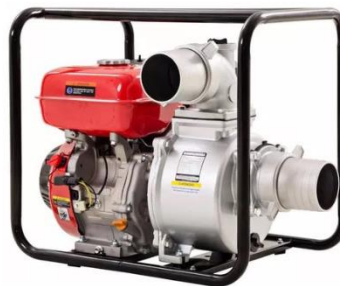
Figura 6 – Imagem de exemplo de bomba centrífuga;