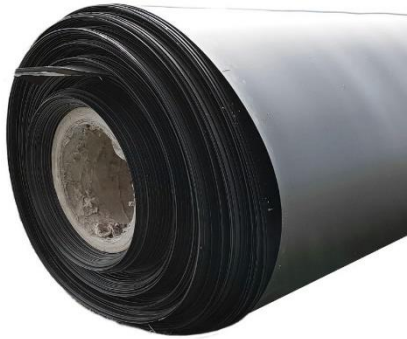
Figura 8 – Imagem da manta geomembrana PEAD 1,0 mm;