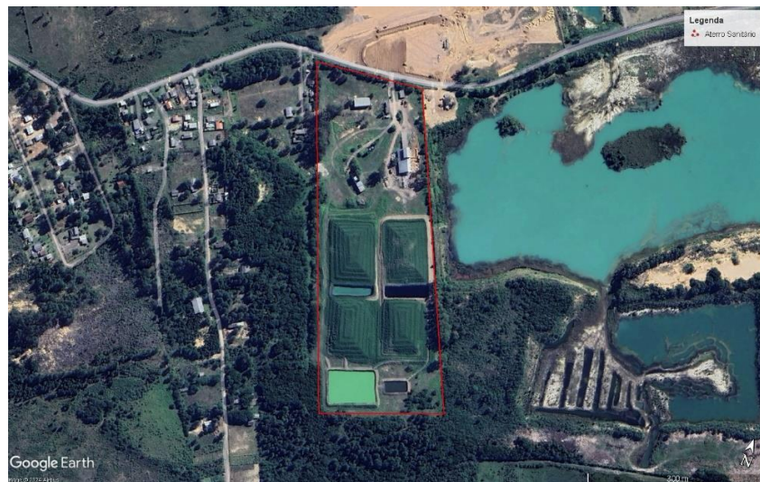
Figura 1 – Imagem retirada pelo aplicativo Google Earth

7.1.3. Coordenadas: 29° 53' 50,06" Latitude Sul, 50° 14' 40,63" Longitude Oeste;