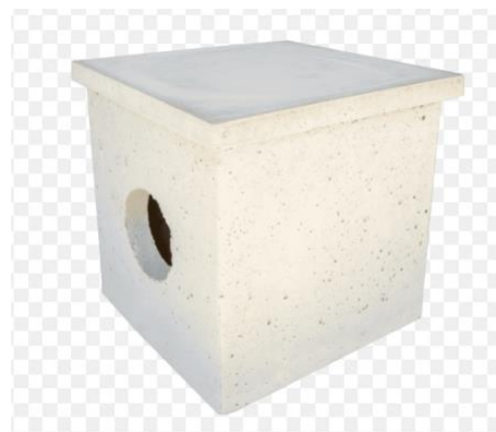
Figura 10 – Imagem do tubo PVC – série R e caixa de passagem de concreto;

Obs.: A empresa deverá fornecer todas as ferramentas, tais como: pás, enxadas, ancinhos, vassouras e outros, bem como os equipamentos de proteção individuais mencionados na introdução, para o bom andamento dos serviços de forma segura;