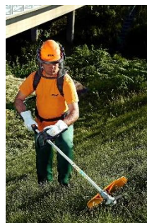
Figura 3 – Trator com roçadeira e roçadeira de costal - EPIs;