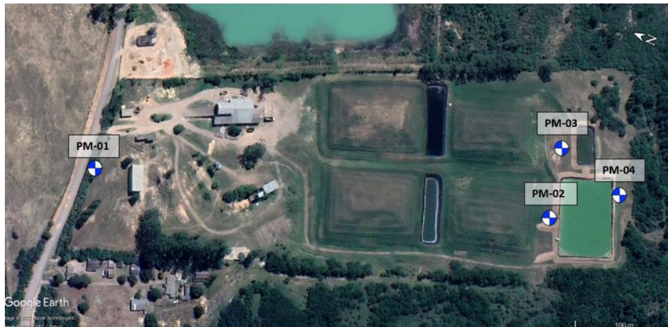
Figura 7 – Imagem de localização dos Poços de Monitoramento (PM 01 a 04);