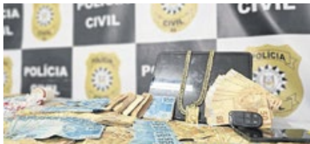
Drogas e dinheiro foram apreendidos em três cidades

“O suspeito possui diversos antecedentes criminais e as atividades ilícitas contam com a participação de sua companheira, que também possui histórico de tráfico de drogas, além de um