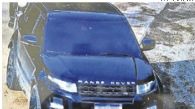
Veículo de traficante foi recolhido durante as buscas

O comando vinha das cadeias. Tanto que, na operação, mandados foram cumpridos em presídios de Charqueadas, Venâncio Ai-