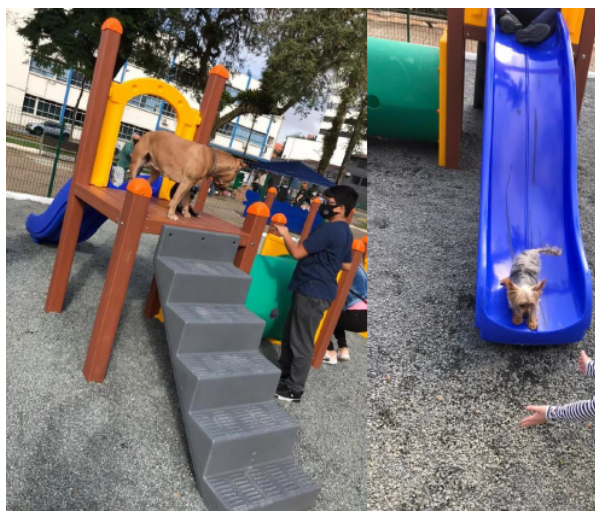
Figura 11 - Playground escada + escorregador

01 Tubo de passagem reto 1600mm com diâmetro interno de 750mm em polietileno rotomoldado. 02 Flange (Painel) medida externa 940mm x 1020mm com furo central de 750mm em polietileno rotomoldado. Sustentação através de duas colunas em madeira plástica medindo 110mm X 110mm e parede de 20mm revestida com acabamento de polipropileno e polietileno pigmentado na cor itaúba.