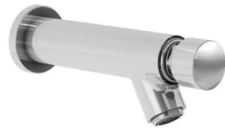
Figura 17 - Torneira automática de parede bica baixa - cromado