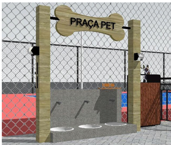
Figura 14 - Placa de identificação com bebedouro Pet

Construída por madeira pinus autoclavado, letreiro de ACM preto carbono brilho, fixado em tubo metálico na cor preta de diâmetro 4cm. Bebedouro construído em granito cinza absoluto, com torneira automática de parede bica baixa – cromado, e cuba de embutir 30 BL aço Inox Polido Ø30 cm.