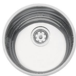
Figura 18 - Cuba de embutir 30 BL Aço Inox Polido Ø30 cm