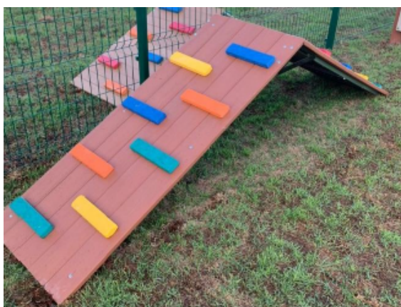
Figura 13 - Escalada sobe-desce

Quantidade: 01 unidade, conforme projeto arquitetônico.