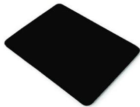
Figura 16 – Placa ACM preto carbono