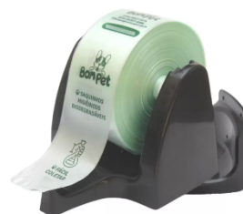
Figura 19 - Suporte bobina multidobra preta tamanho 15cm x 13cm