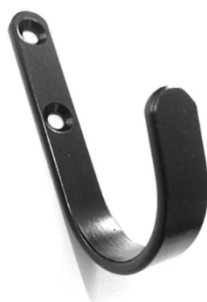
Figura 20 – Gancho de parede metálico preto tamanho 15cm x 4cm