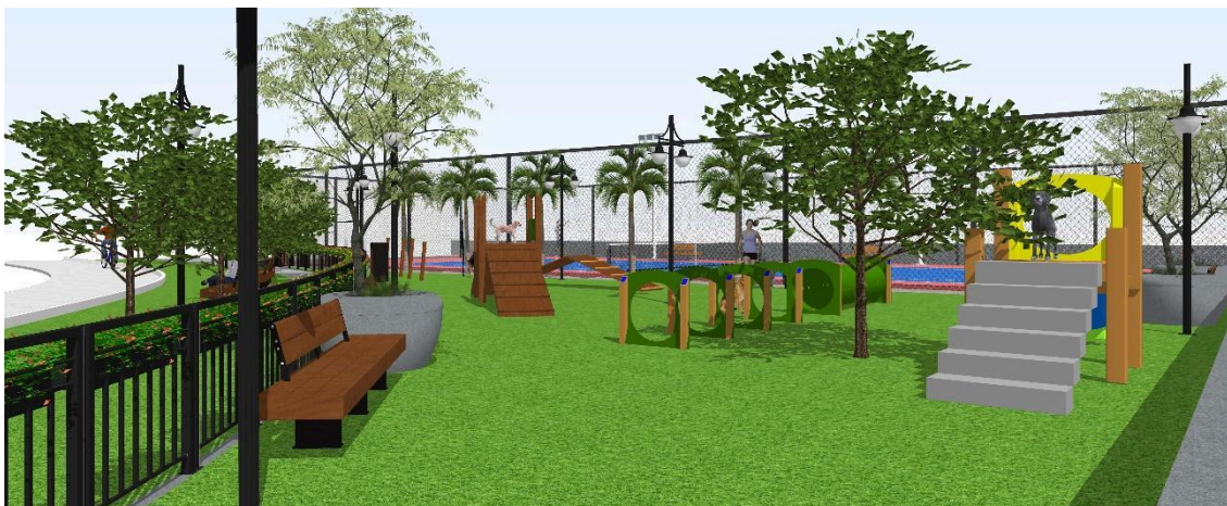
Figura 2 – Vista Praça Pet e Quadra de Tênis