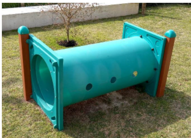
Figura 12 - Túnel de passagem (reto)

02 rampas com assoalho produzido em madeira plástica na cor itaúba, dimensão 1750 mm de comprimento X 790 mm de largura e 07 tacos produzidos em polietileno unidas e sustentadas por barra metálica.