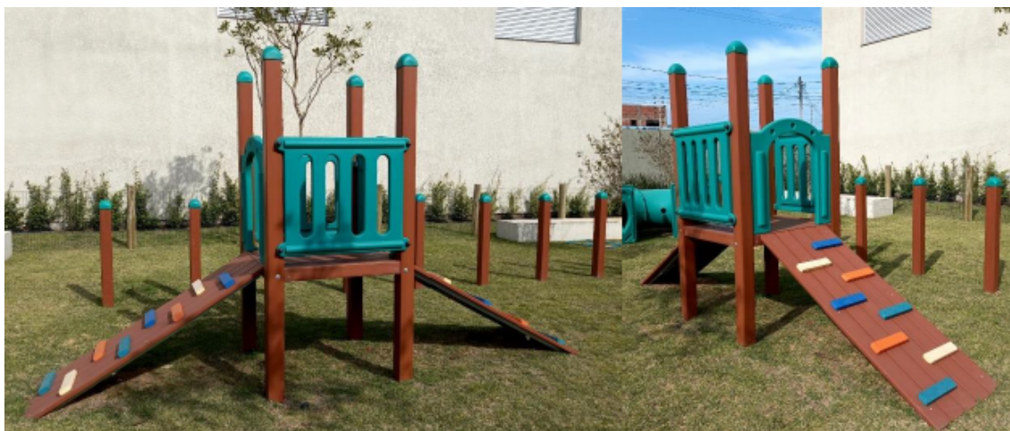
Figura 10 - Playground escalada dupla

Torre composta por 04 colunas e assoalho produzidos em madeira plástica, com revestimento em polietileno pigmentado na cor itaúba. Acesso através de escada com 5 degraus, de dimensão aproximada 1650 mm x 600mm (CxL) produzida em polietileno rotomoldado, de parede dupla. Descida através de escorregador ondulado, de dimensão de 2350mm x 540mm (CxL), seção de deslizamento com largura de 460 mm produzido em polietileno rotomoldado com parede dupla.