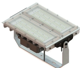
Figura 4 - Referência refletor de LED industrial

As unidades dos quatro postes de iluminação para a quadra de tênis, com altura de 9 metros, deverão ser instaladas sobre sapata moldada in loco, localizadas conforme projeto arquitetônico, sendo a fixação com chumbadores. Em cada poste deverá ser instalado 3 unidades de projetor/refletor industrial de LED, específicos para iluminação de quadra esportiva, com 150W de potência, classificação IP mínima IP66, mínimo 15000 lumens, branco frio 6500K.