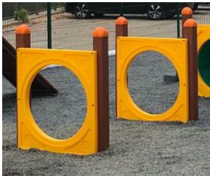
Figura 9 - Círculo para salto

Torre composta por 04 colunas e assoalho produzidos em madeira plástica, com revestimento em polietileno pigmentado na cor itaúba. Acesso através de 02 rampas com assoalho em madeira plástica na cor itaúba, dimensão 1750 mm de comprimento X 790 mm de largura e 07 tacos produzidos em polietileno com cores diversas. 02 Guarda corpo de dimensão 870mm x 770mm produzidos em polietileno rotomoldado, parede dupla.