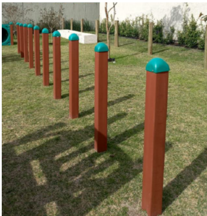
Figura 8 - Coluna ZIG-ZAG.

Painel com furo central circular de 750mm e medida externa 940 mm x 1020 mm produzida em plástico rotomoldado. Sustentação através de duas colunas em madeira plástica medindo 110mm X 110mm e parede de 20mm revestida com acabamento de polipropileno e polietileno pigmentado na cor itaúba.