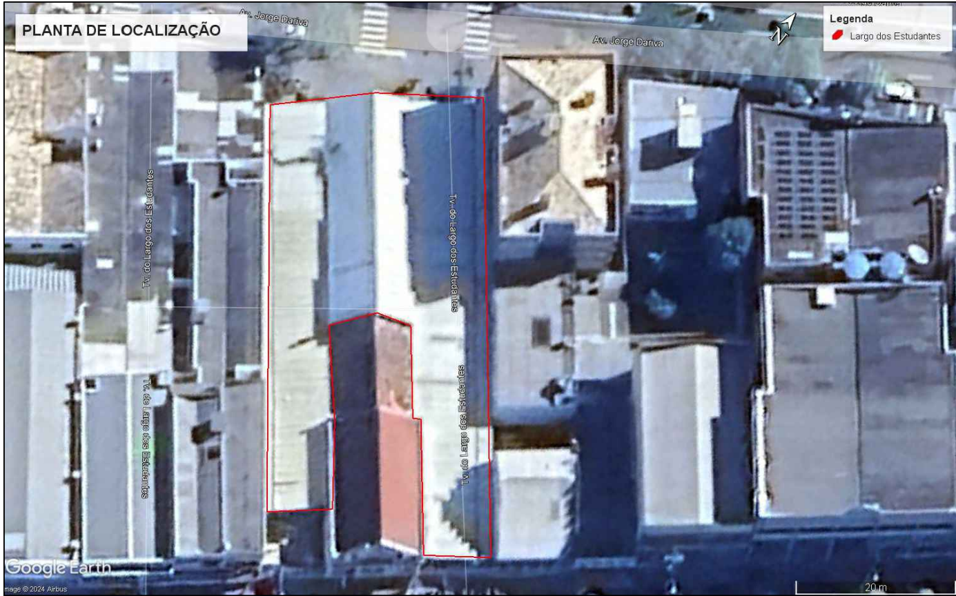
PLANTA LOCALIZAÇÃO esc 1:1000