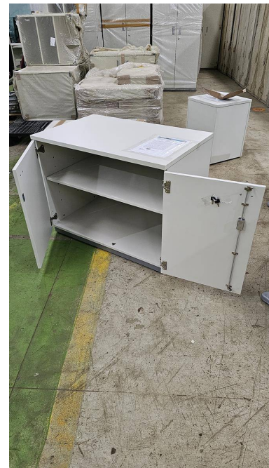
Fig. 02: Armário Baixo com 2 Portas - AB1 - Amostra fornecida