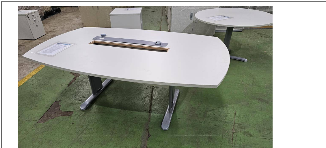
Fig. 13: Mesa para Reunião 8 lugares – MR8P - Amostra fornecida

07) Mesa para Reunião 8 lugares – MR8P – Através de inspeção visual simples foi constatado que o item não atende ao exigido pelo edital nos seguintes aspectos: a tampa metálica no tampo não é basculante e não há suporte interno com caixas de tomadas e módulos USB / RJ45.