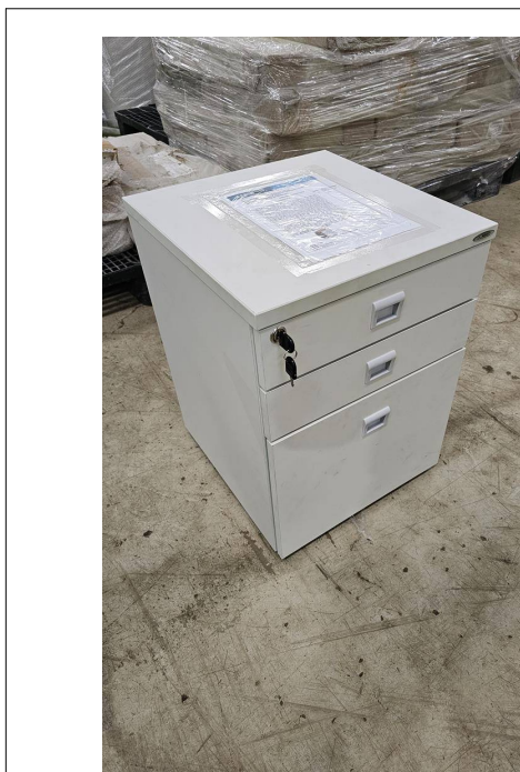
Fig. 03: Gaveteiro com 3 Gavetas - GV3 - Amostra fornecida

02) Gaveteiro com 3 Gavetas - GV3 – Através de inspeção visual simples foi constatado que o item não atende ao exigido pelo edital nos seguintes aspectos: as corredeiras das gavetas – exceto gavetão – não são telescópicas. Além disso, os rodízios são fixados diretamente no MDF, sem as buchas de nylon descritas no edital.