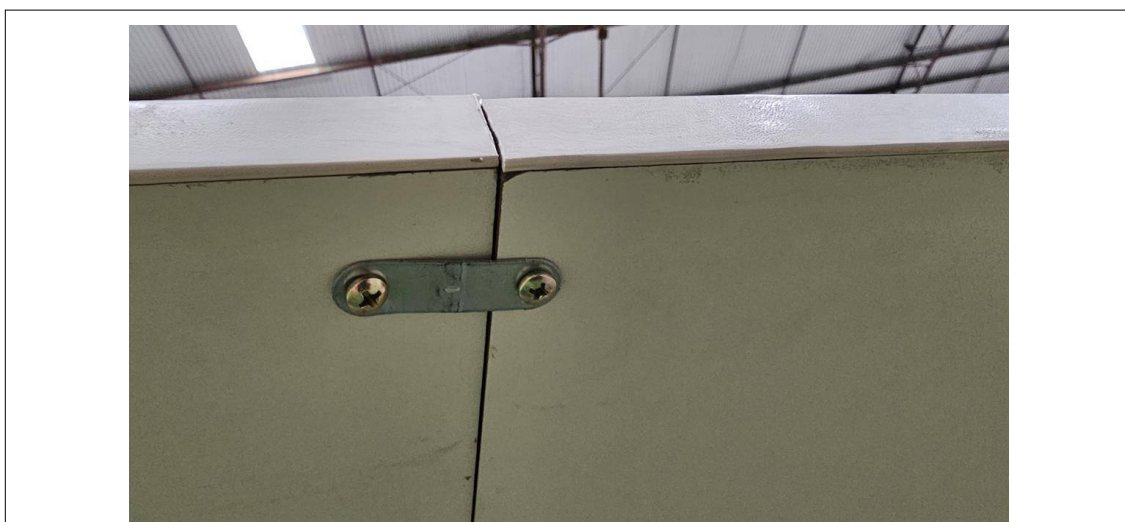
Fig. 18: Mesa para reunião 10 lugares – MR10P - Amostra fornecida