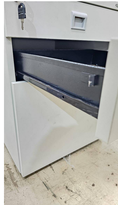
Fig. 04: Gaveteiro com 3 Gavetas - GV3 - Amostra fornecida