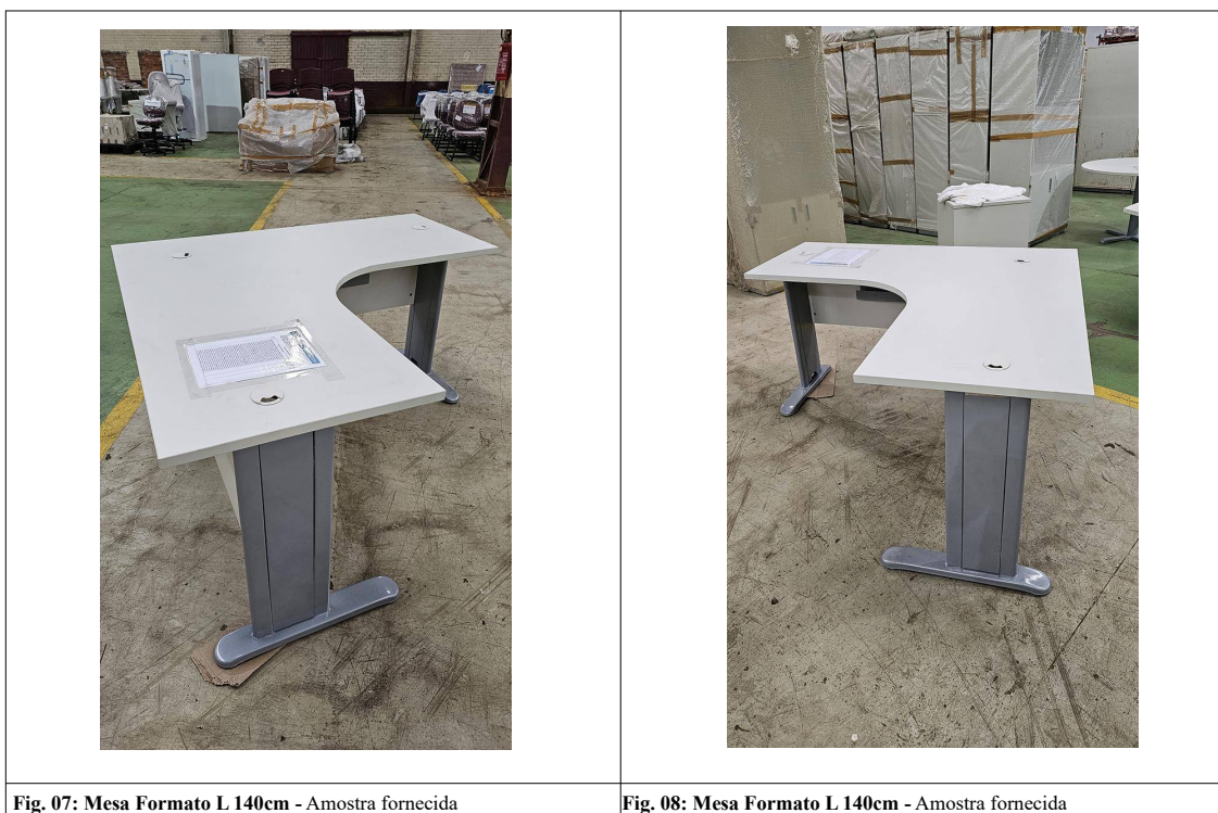
Fig. 07: Mesa Formato L 140cm - Amostra fornecida

04) Mesa Formato L 140cm – Através de inspeção visual simples foi constatado que o item não atende às dimensões de tampo exigidas pelo edital, apresentando largura e profundidade de 1395mm.