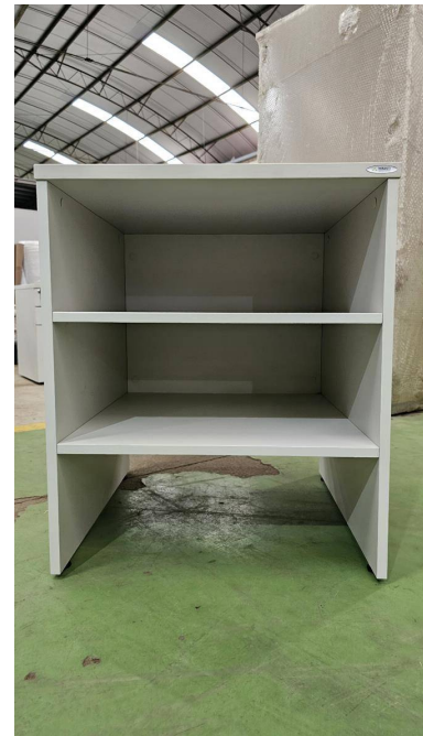
Fig. 06: Mesa para Impressora - SR10 - Amostra fornecida