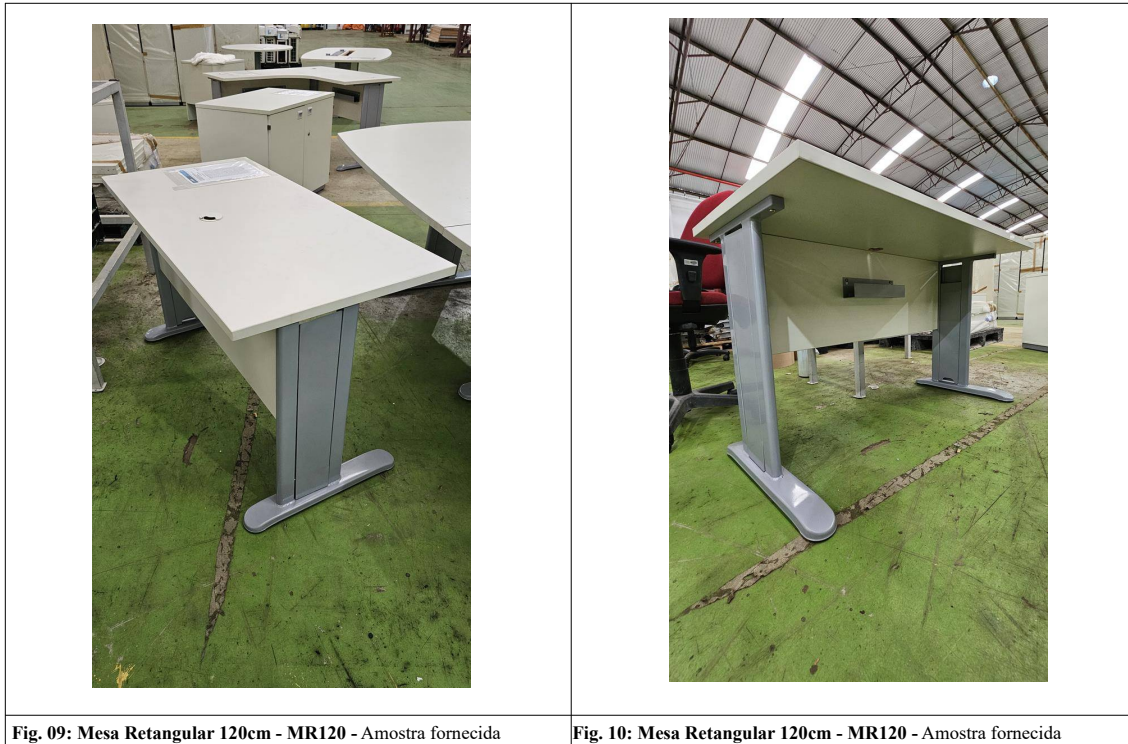
Fig. 09: Mesa Retangular 120cm - MR120 - Amostra fornecida

05) Mesa Retangular 120cm - MR120 – Através de inspeção visual simples foi constatado que o item atende ao exigido pelo edital.