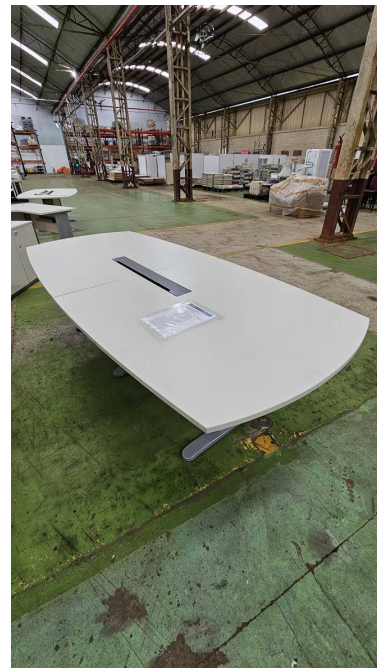
Fig. 16: Mesa para reunião 10 lugares – MR10P - Amostra fornecida