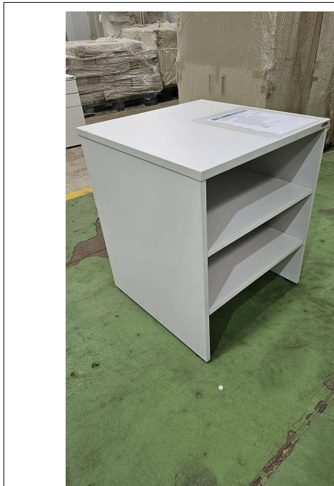
Fig. 05: Mesa para Impressora - SR10 - Amostra fornecida

03) Mesa para Impressora - SR10 – Através de inspeção visual simples foi constatado que o item atende ao exigido pelo edital.