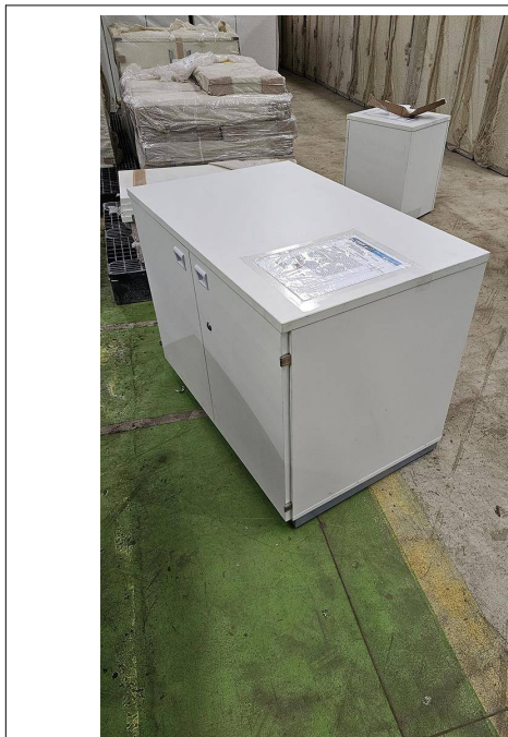
Fig. 01: Armário Baixo com 2 Portas - AB1 - Amostra fornecida

01) Armário Baixo com 2 Portas - AB1 – Através de inspeção visual simples foi constatado que o item atende ao exigido pelo edital.