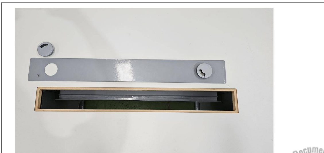
Fig. 14: Mesa para Reunião 8 lugares – MR8P - Amostra fornecida