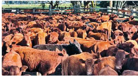
Baixa disponibilidade de pastagem levou criadores a vender mais lotes

Essa redução drástica, segundo Barcellos, é atribuída, entre outros fatores, ao impacto da estiagem, que reduziu a alimentação para o gado. "A seca alterou o ânimo dos pecuaristas, que forçaram muito a oferta. O número de animais ofertados deste ano é superior em 30% em re-