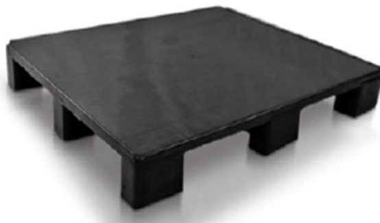
IMAGEM DE REFERÊNCIA DOS PALLETS (modelos de referência):