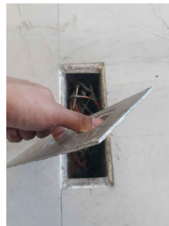
MODELO DE CHAPA METÁLICA ORIGINAL EXISTENTE