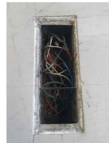
EXEMPLO DE CAIXA DE PASSAGEM A SER FECHADA COM AS TAMPAS