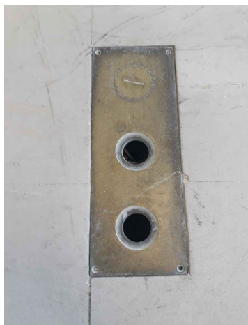
MODELO DE CHAPA METÁLICA ORIGINAL EXISTENTE