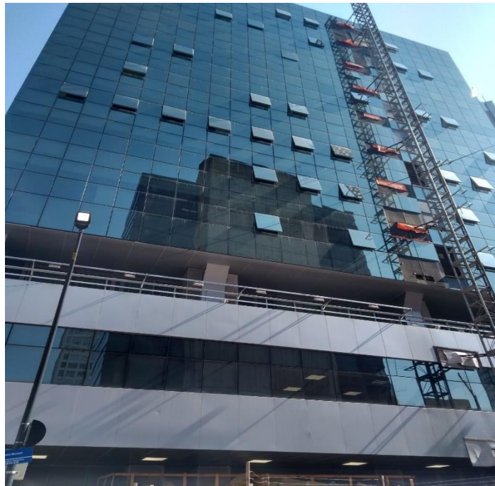
Figura 2: Fachada B

DEFENSORIA PÚBLICA ESTADO DO RIO GRANDE DO SUL