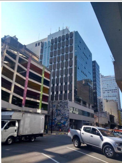
Figura 4: Fachada C

DEFENSORIA PÚBLICA ESTADO DO RIO GRANDE DO SUL