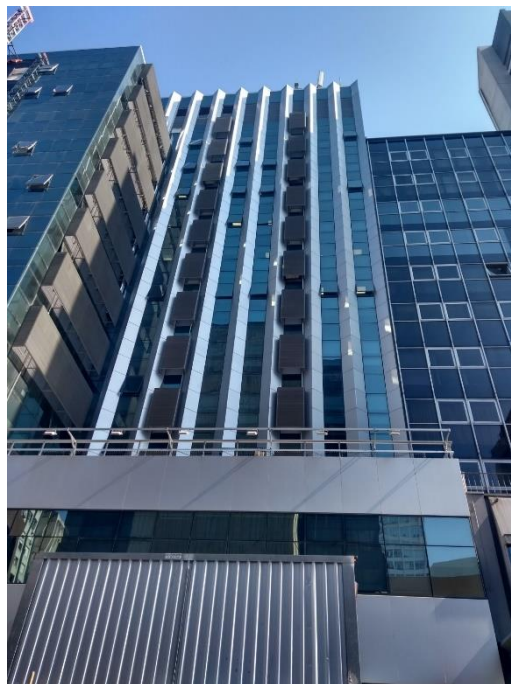
Figura 3: Fachada B1