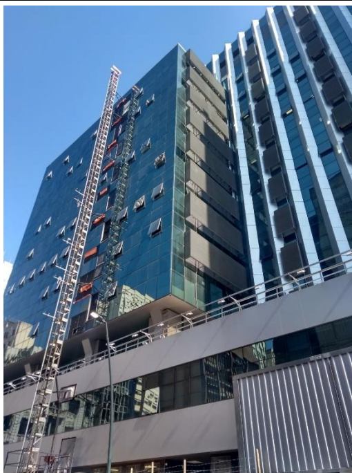
Figura 5: Fachada D3