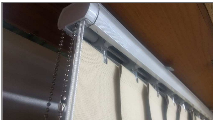
Foto 04: Trilho em Alumínio, acessórios plásticos e material metalizado, modelos blackout