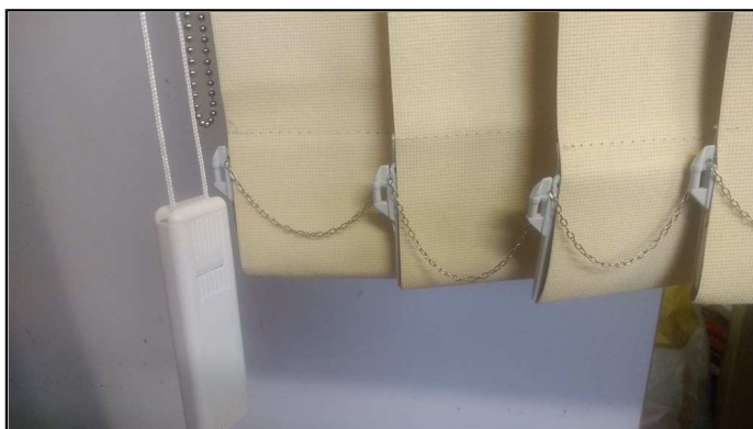
Foto 05: Lâminas, pouca transparência nos modelos blackout. Correntes em material metálico.

João Luiz de Andrade Salles Téc. em Edificações DEAM