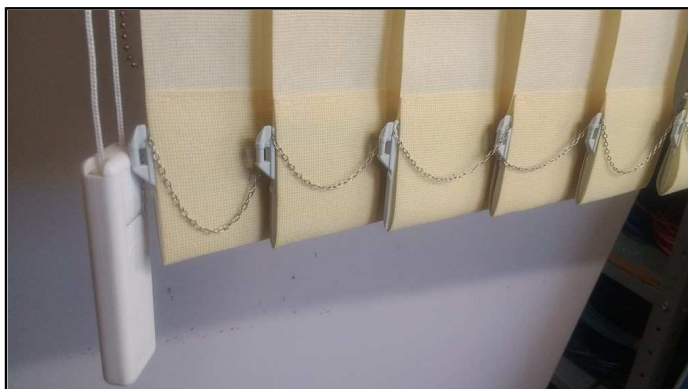
Foto 02: Correntes em material metalizado, detalhe do tecido em poliéster