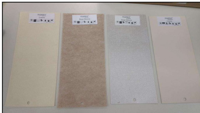
Foto 04: Lâminas extras, contemplando outros tecidos de poliéster e dois modelos blackout