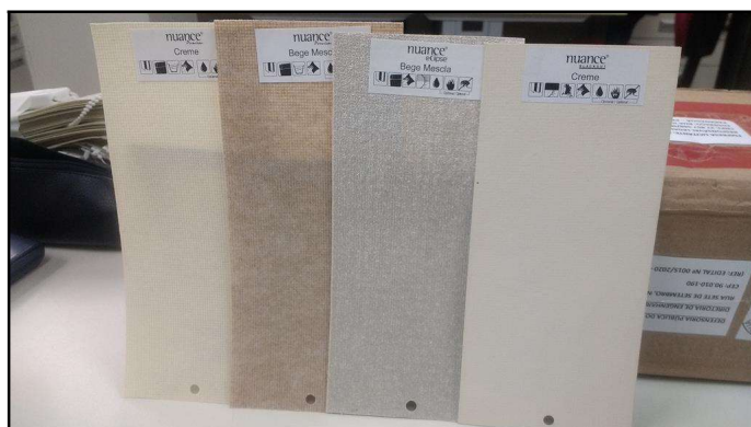
Foto 05: Lâminas extras, pouca transparência nos modelos blackout

João Luiz de Andrade Salles Téc. em Edificações DEAM