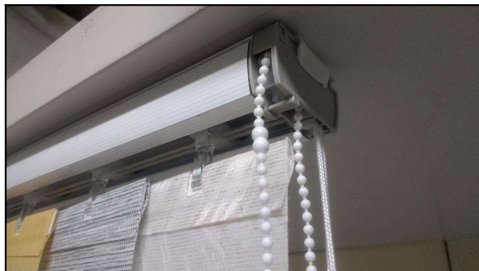
Foto 01: Trilho em Alumínio na cor Branco e acessórios em material plástico