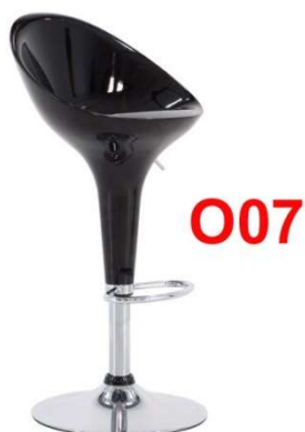
Banqueta Acrílica Preta - BAALPR-0036 5 unidade

Critério de Medição: Por unidade entregue e montada no local indicado em projeto ou depositada no local indicado pela Fiscalização, para mobiliário fornecido conforme especificado, nos modelos e linhas aprovados pela Fiscalização.