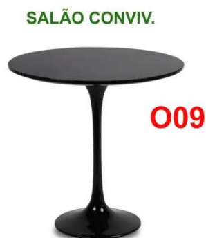
Mesa Design Saarinen Pelegrin PEL 1994 Redonda 90cm - Pelegrin com tampa MDF preto com alto brilho

Modelo: Mesa Design Saarinen Pelegrin PEL 1994 Redonda ou similar